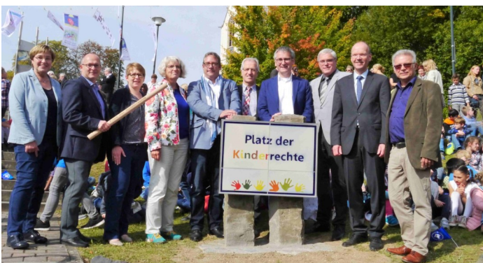
Eröffnung des ersten Platzes der Kinderrechte in Hör-Grenzhausen

Mittlerweile sind die Kinderrechte vollständig aufrufbar, mit Erklärungen für Kinder und Eltern, sowie passenden Angeboten.