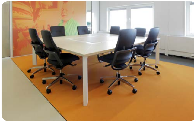
Die Kabelrinne ist von jeder Seite aus zugänglich.