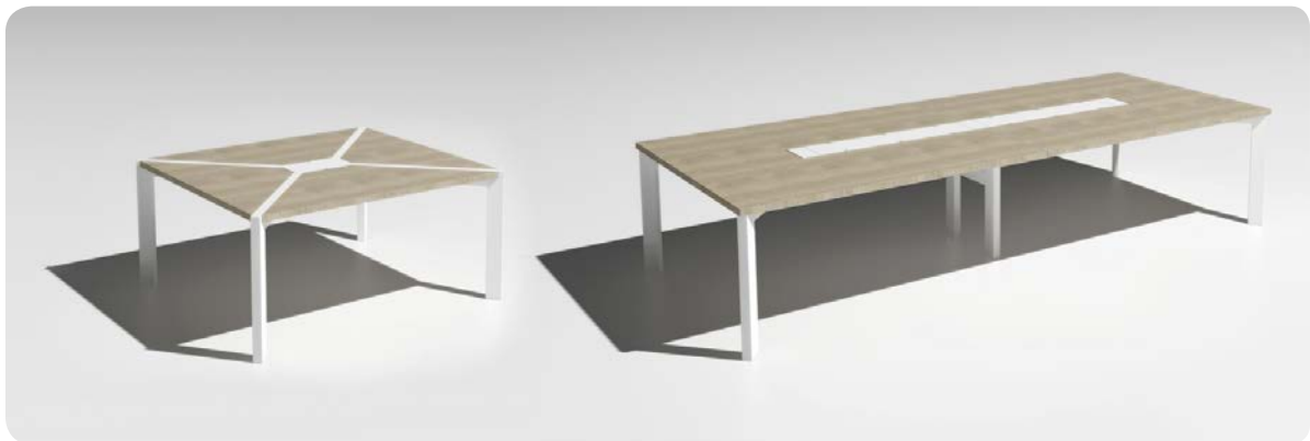
Wahlweise mit integrierter oder aufliegender Tischplatte, in diversen Abmessungen erhältlich.