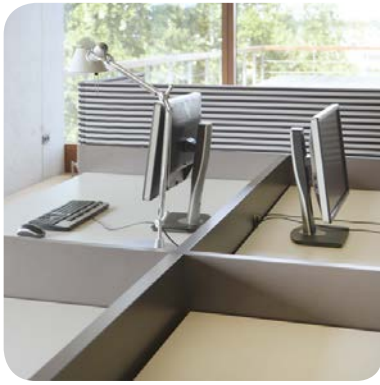
Arbeitsplätze verbinden, auch rechtwinklig zueinander stehende Tische.