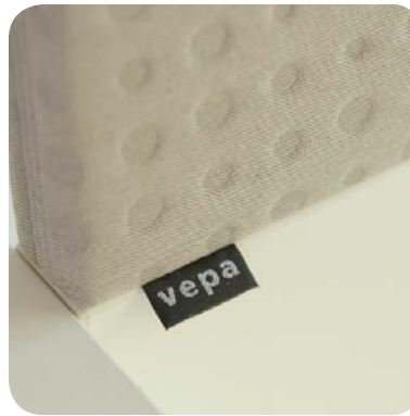
Wahlweise mit verkleideter Aufsatzwand für mehr Privatsphäre oder konzentriertes Arbeiten.