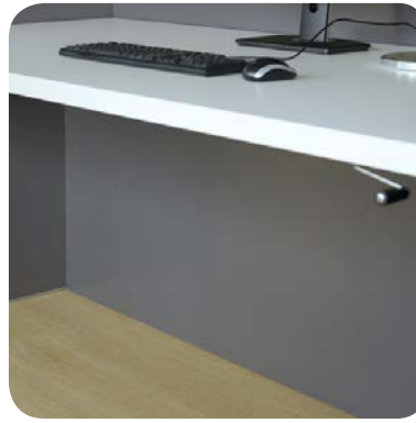
Wahlweise mit Trennwand für mehr Privatsphäre oder konzentriertes Arbeiten.