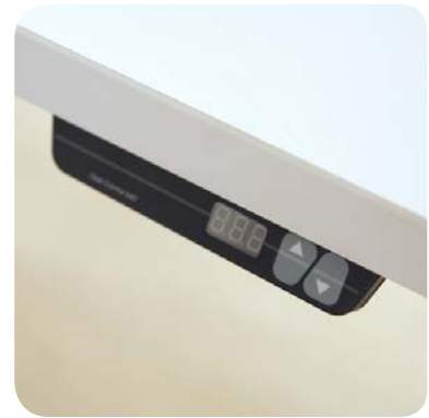
Erhältlich in fester Höhe oder höhenverstellbar (Kurbel oder elektrisch).