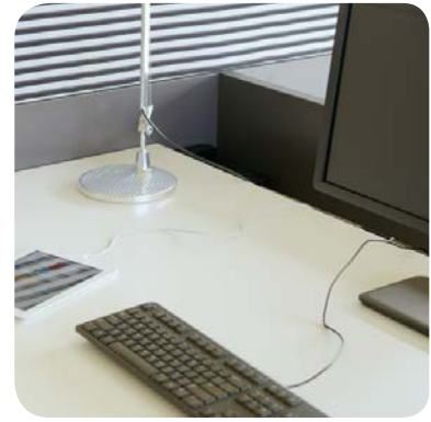
Wahlweise mit ausziehbarer Tischplatte. Stecker und Internetzugang in Kabelrinne.