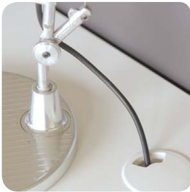
Wahlweise mit Netzzugang in der Tischplatte.