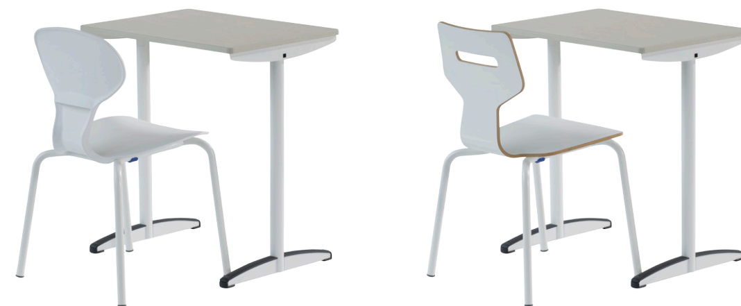
Gripz mit Lesca