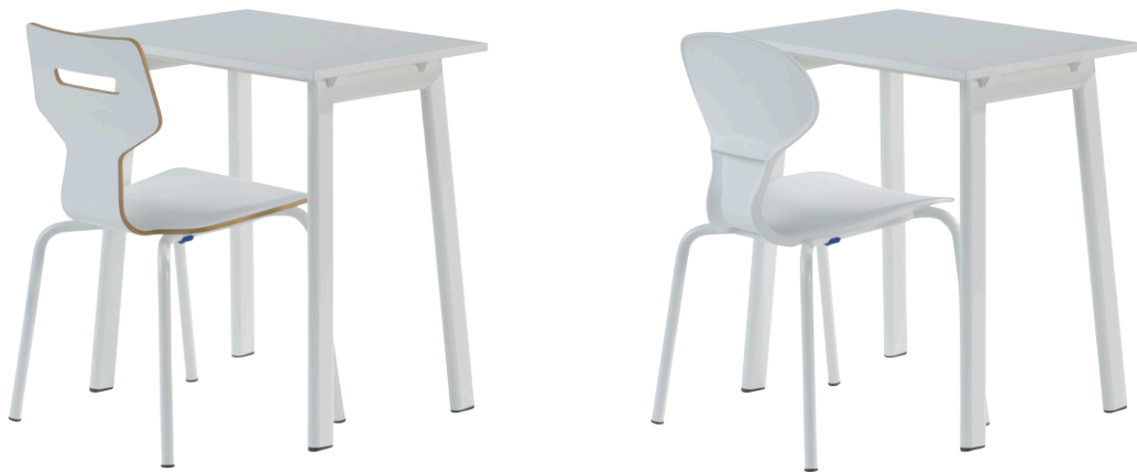
Gripz mit Mix 4-Bein