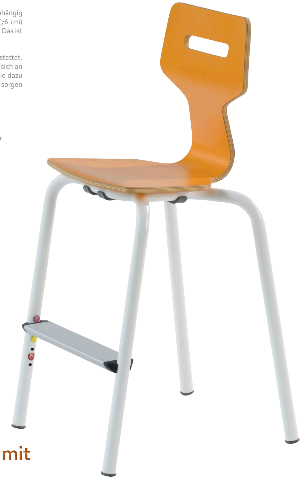
GRIPZ FLEX 4-BEIN mit HOLZ-SITZSCHALE