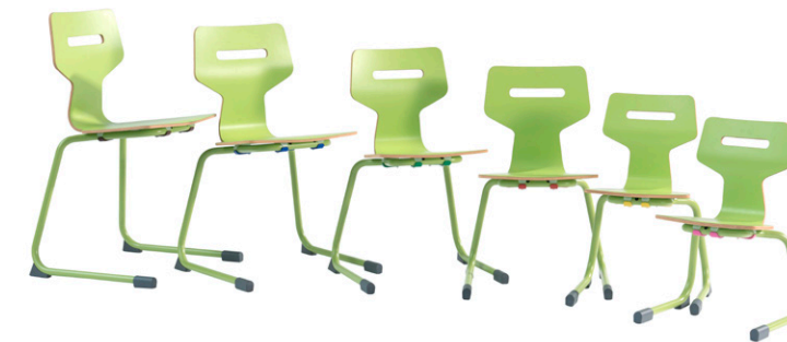
GRIPZ C-FUSS mit HOLZ-SITZSCHALE