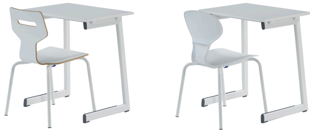
Gripz mit Mix