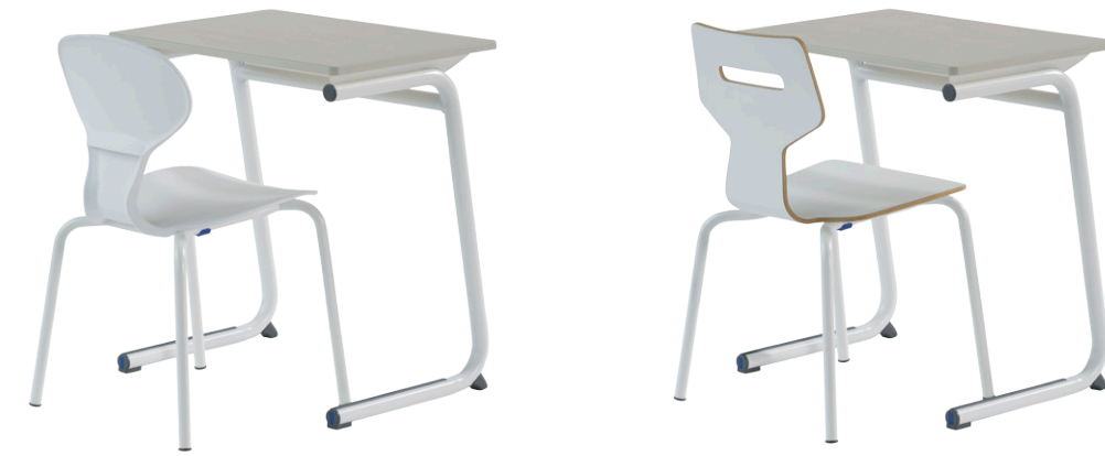
Gripz mit Steady