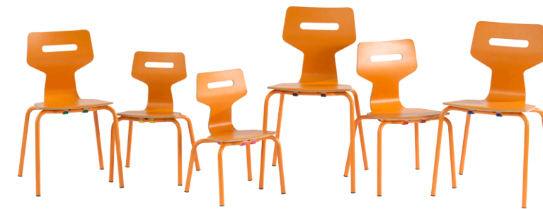
4-BEIN-STUHL mit HOLZ-SITZSCHALE