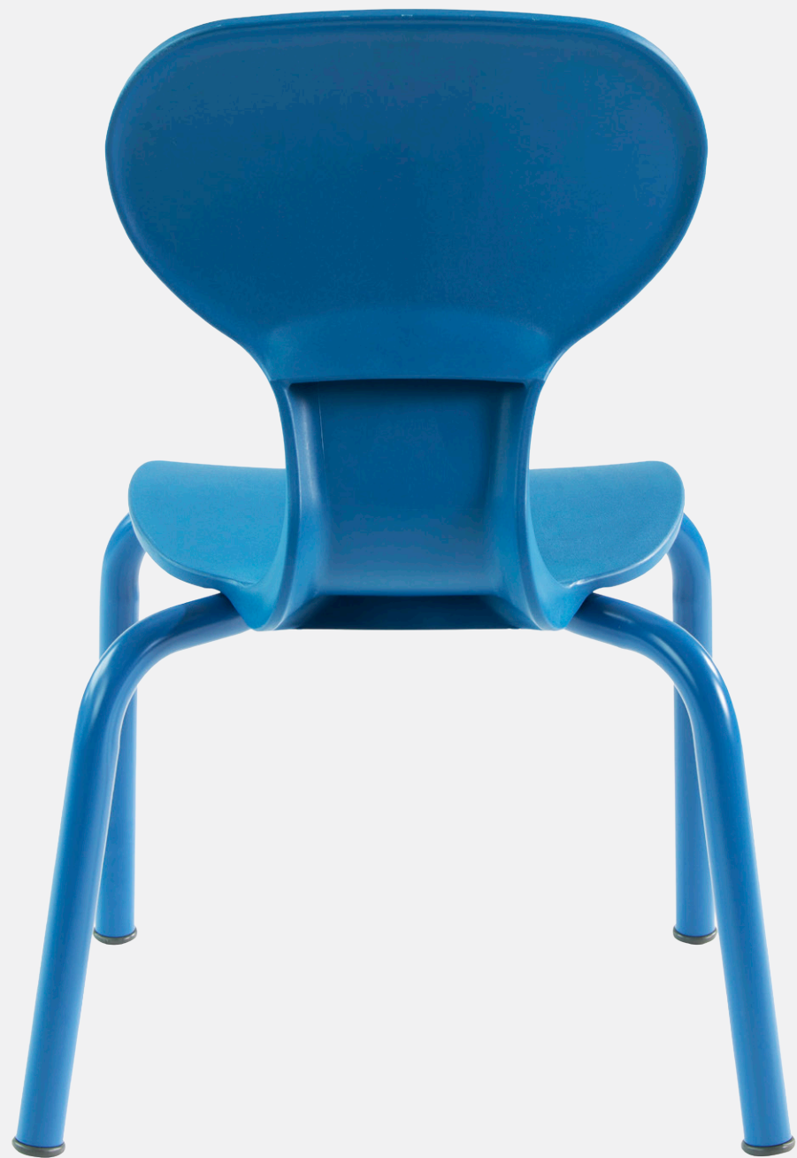
4-BEIN-STUHL mit KUNSTSTOFF-SITZSCHALE