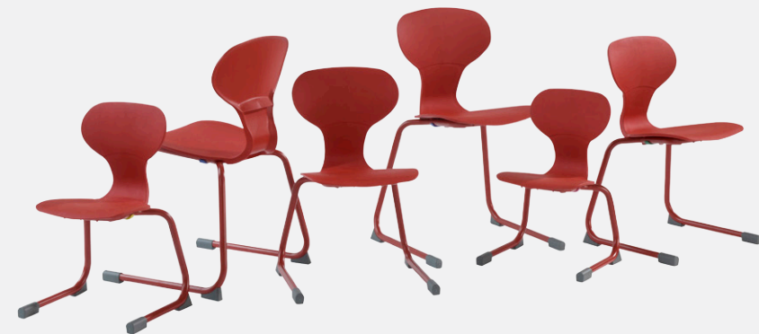
GRIPZ C-FUSS mit KUNSTSTOFF-SITZSCHALE

Die Befestigungsklammern aus Kunststoff schützen die Tischplatte vor Beschädigungen.