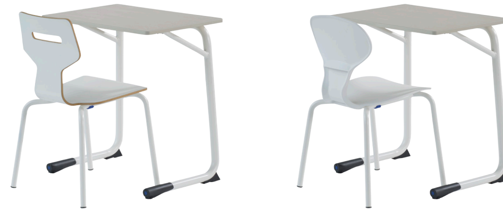
Gripz mit Secundo