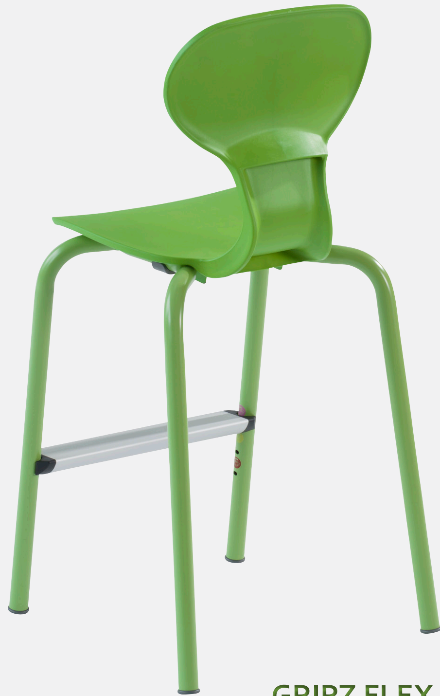
GRIPZ FLEX 4-BEIN mit KUNSTSTOFF-SITZSCHALE