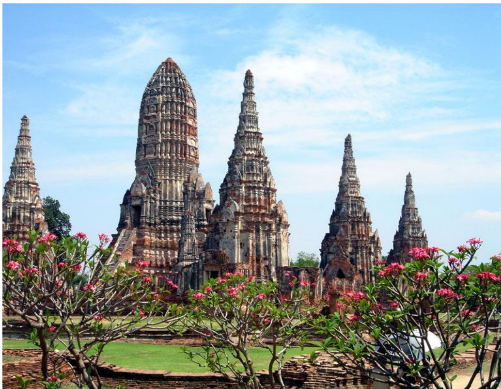
Tempelanlage Wat Phra Sri Sanpet, Ayutthaya, Thailand