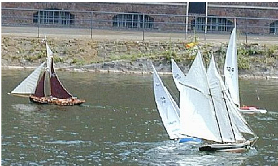
Bei solchen Halsen wie hier im Bild bewährt sich dieser kleine Trick besonders. Und wie zu sehen war die Smack Nellie und Lesslie von Gerold Schnebbe ohne Schwierigkeiten als erste um die Boje herum.

Dabei besonders unangenehm: Die Schot war nach mehreren Schlingen um die Deckseinrichtungen herum soweit verkürzt und damit dichtgeholt, daß bei stärkeren Wind das Modell bis zum Wasserschöpfen überholte - mit weiteren möglichen Folgen.