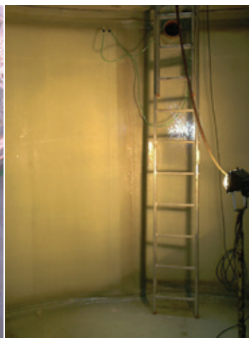
Abb.: Einbringluke und Ansicht nach der Vor-Ort-Montage einer doppelwandigen Auskleidung für eine Abwassergrube mit 50.000 l Nutzvolumen