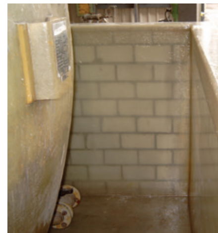
Abb.: GFK-Auskleidung für die Abmauerung eines Altöltanks

Die Raumauskleidung der Firma Haase GFK-Technik GmbH besitzt die allgemeine bauaufsichtliche Zulassung