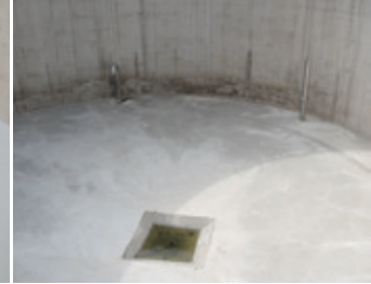
Abb.: GFK-Auskleidung für ein Becken zum Auffangen von Klärschlamm

das Material haben sich bereits zigtausendfach beim Haase-Kellertank bewährt.