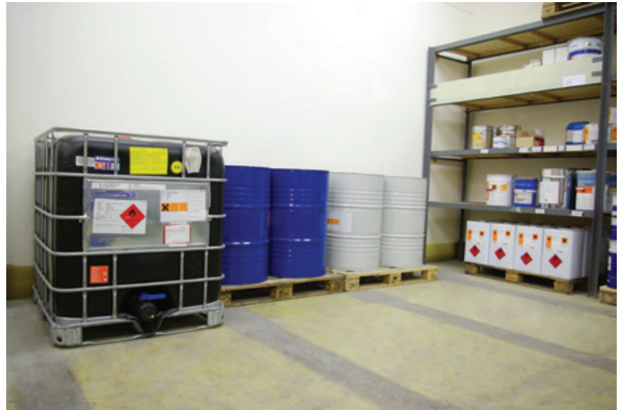
Abb.: GFK-Raumauskleidung eines Chemikalienlagers

Die Raumauskleidung von Haase besteht aus hochwertigem glasfaserverstärkten Kunststoff (GFK). Dieses Material ist beständig gegen eine Vielzahl von Medien, korrosionsfrei, vakuumdicht, formstabil und alterungsbeständig. Zusätzlich bietet der Werkstoff hohe Steifigkeit bei geringem Gewicht.