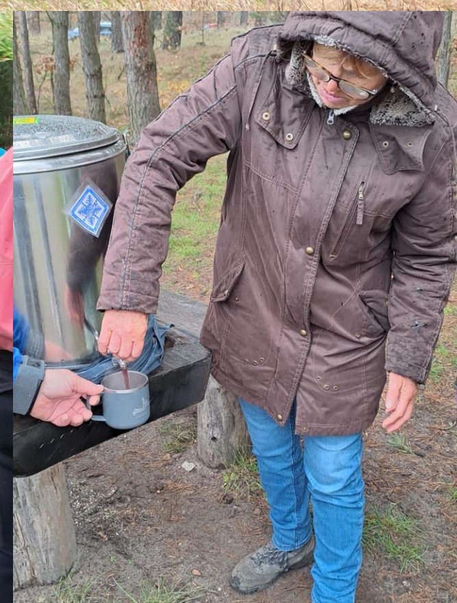
Hier müssen wir richtig sein! Pause: Glühwein, der Grill ist im Gange und auch ein Lagerfeuer – Super!