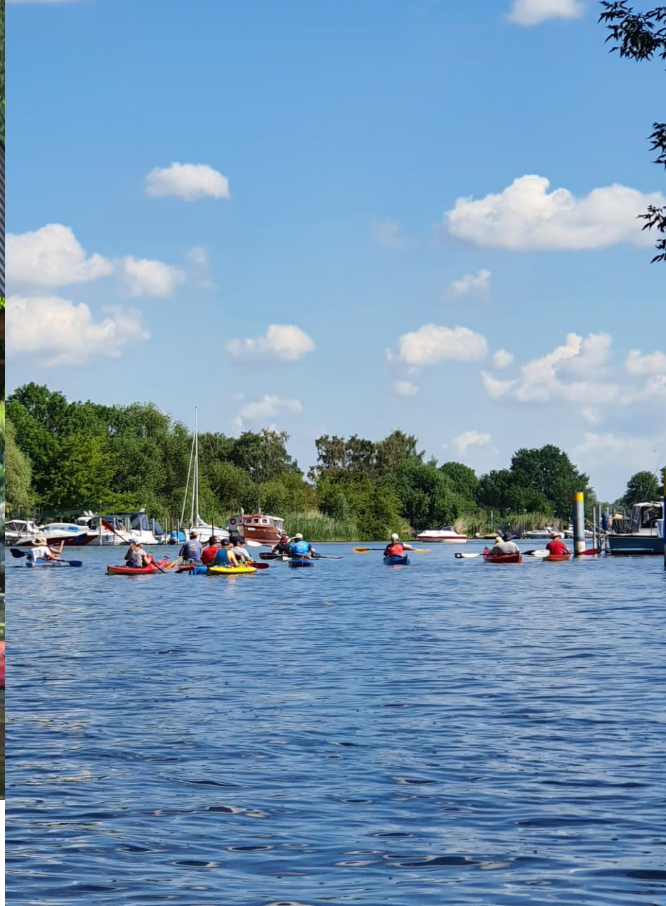
Los geht's: wir paddeln nach Radewege, dort wartet eine Badestelle und Picknick auf uns.