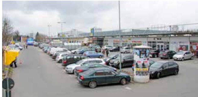
Sie können helfen, das Centerumfeld schöner zu gestalten.

Eine tolle Idee wurde als Wunsch aus der Bevölkerung durch den Bürgermeister an das Center herangetragen und prompt umgesetzt. Die Treppe, die aus Richtung Muskauer Straße auf das Gelände des Einkaufszentrums führt, hat einen neuen Handlauf mit einer innenliegenden LED-Beleuchtung erhalten. Auch als Ersatz für die durch Vandalismus zerstörte seitliche Wegebeleuchtung an der Treppe wird eine neue LED-Variante installiert.