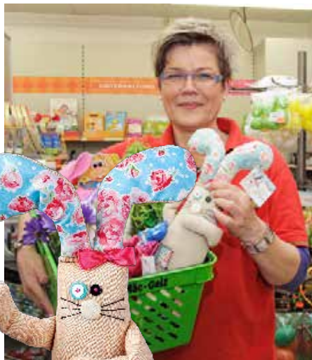
Dekovielfalt zum kleinen Preis!

Wer preisbewusst und trotzdem hochwertig einkaufen will, der kommt an Mäc-Geiz nicht vorbei. Das gilt zu Ostern mehr denn je. Die verrückte Plüschhäs in Oster Mäggi hat nämlich unzählige hasenstarke Dekoartikel mitgebracht. Die Regale sind aber auch mit Schokohasen von „Milka“ bis „Kinder“ sowie vielen weiteren Süßigkeiten und Spielwaren für die Ostertüte der Kleinen gefüllt. All das gibt es nur hier zu unschlagbaren Schrottenpreisen. Selbst für den geliebten Vierbeiner daheim oder für andere Haustiere gibt es Osterleckerlies. Die geräumige Filiale in der Saschowawiese lädt ab sofort zum großen Ostershopping. Wünsche erfüllen und dabei sparen - das können Sie nirgends besser!