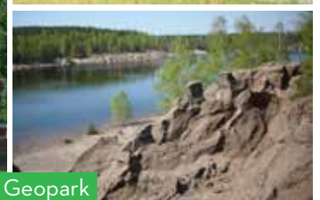
Die Saison startet: von der Waldeisenbahn bis zum Geopark