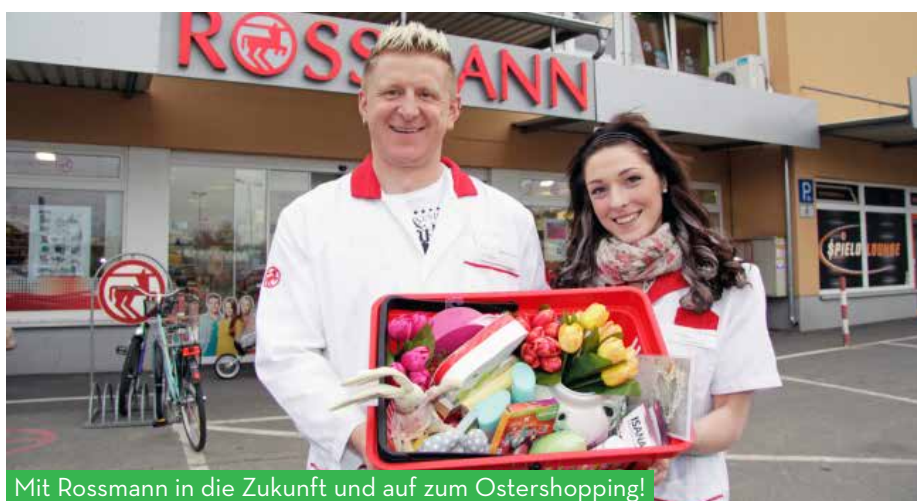
Mit Rossmann in die Zukunft und auf zum Ostershopping!