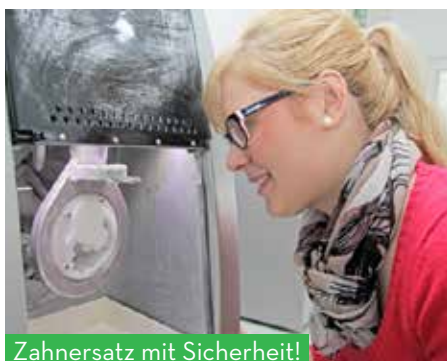
Zahnersatz mit Sicherheit!

Das Dental-Labor Günther & Steinhoff informiert.