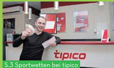
S.3 Sportwetten bei tipico