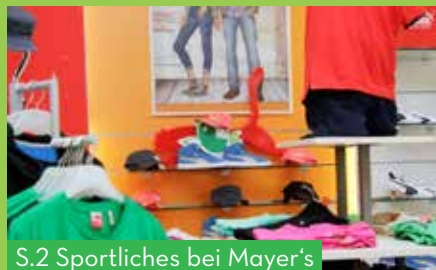
S.2 Sportliches bei Mayer's