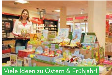
Viele Ideen zu Ostern & Frühjahr!