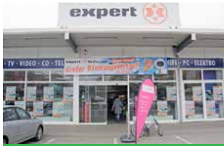
Räumungsverkauf bei Expert

Sicher haben Sie es auch gesehen: der Elektronikfachmarkt Expert verlässt unser Einkaufszentrum und lädt derzeit zum großen Räumungsverkauf. Natürlich wird in solchen Situationen gern und viel spekuliert, und auch die Tageszeitung schreibt in Weißwasser gern von Problemen wie Ladenleerstand anstatt über positive Entwicklungen zu berichten. In unserem Fall gibt es nämlich die positive Nachricht: Rossmann hat sich so lange wie noch nie zum Standort in der Saschowawiese bekannt und möchte sein Engagement nicht nur verlängern, sondern hier ein größeres und modernes Ladengeschäft der nächsten Generation errichten. Dazu ist mehr Fläche notwendig, weshalb dem Freizug der Fläche von Expert in den kommenden Monaten auch noch das Friseurgeschäft und der Geschenkeladen folgen werden. Bereits im Frühsommer beginnen wir dann mit den vorbereitenden Arbeiten und im