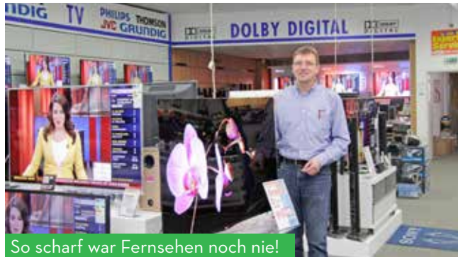
So scharf war Fernsehen noch nie!

Konzert mit der Band „Die Prinzen“, Ev. Kirche Weißwasser