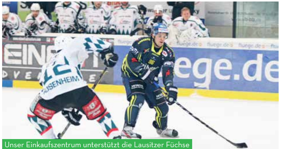
Unser Einkaufszentrum unterstützt die Lausitzer Füchse

OLED bedeutet organic light emitting diode und ist die Weiterentwicklung der klassischen LED. OLED-TV ist Premium-Fernsehen auf einem riesigen Bildschirm mit superhoher Auflösung. Jedes Detail ist überaus klar und konturiert, Farben und Bewegungen sind gestochen scharf. Die leichte Rundung des Displays ist verantwortlich für ein Fernseh-Erlebnis im Kino-Format.