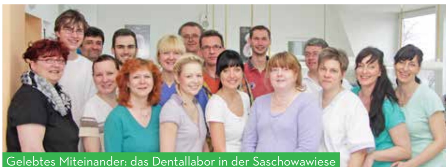
Gelebtes Miteinander: das Dentallabor in der Saschowawiese