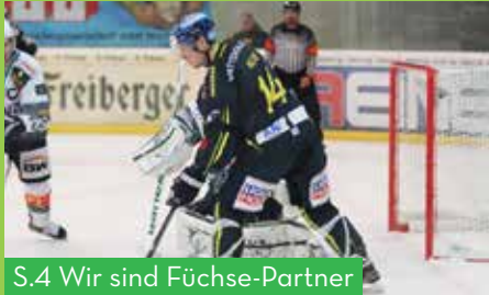
S.4 Wir sind Füchse-Partner