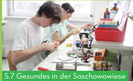
S.7 Gesundes in der Saschowawiese