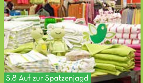
S.8 Auf zur Spatzenjagd