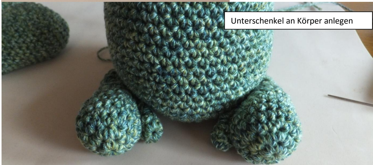
Unterschenkel an Körper anlegen