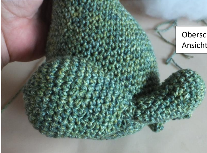
Oberschenkel annähen Ansicht Seite