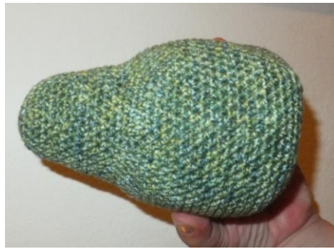
Formt beim Füllen einen Bauch