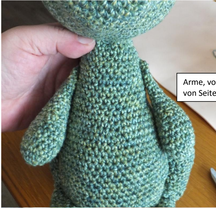
Arme, von vorne und unten im Bild von Seite