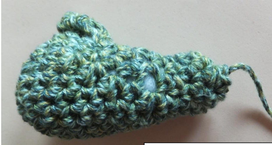
Großer Zeh an Unterschenkel

Dann der Schwanz, danach die Arme und zuletzt die Flügel, schaut auf die Fotos