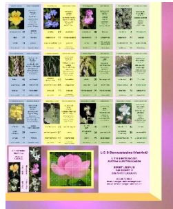
Ausschnitt der L-E-B Bewusstseins Matrix