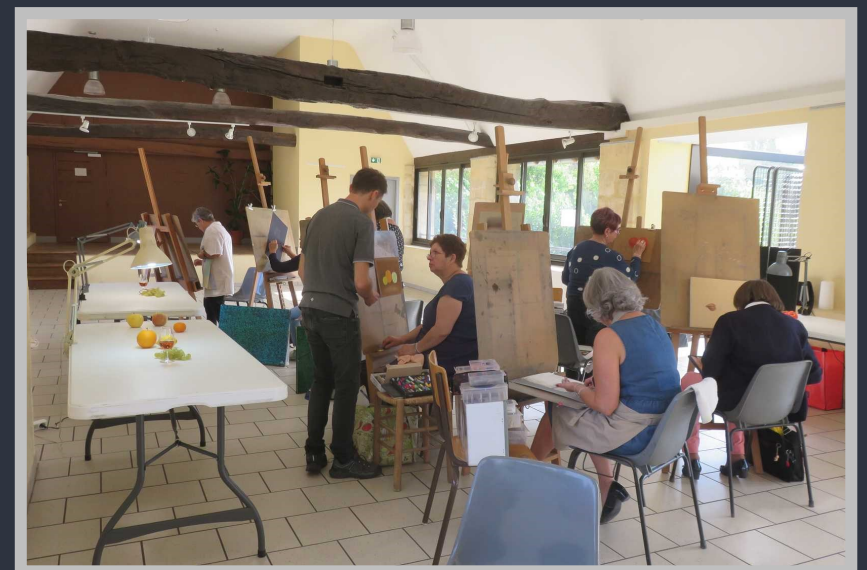
Stage réalisé lors du festival