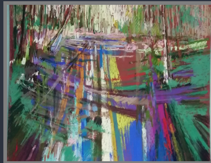
Stéphane Le Mouël—Profondeur