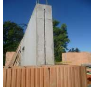
Hoch- und Ingenieurbau