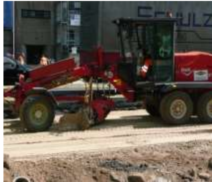
Tief- und Straßenbau