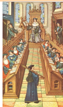
A meeting of doctors at the university of Paris. From a medieval manuscript of "Chants royaux". Bibliothèque Nationale, Paris (domaine public)

Cette nouvelle rencontre CIRUISEF souhaite faire échanger les Doyens et les Responsables des Ecoles doctorales de l'espace francophone sur leurs expériences : afin que les Docteurs issus de nos formations soient des scientifiques accomplis et des citoyens responsables des avancées de la recherche et du développement de la Société et de la Planète.