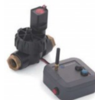
Contrôleur de valves

Appelez le 06 48 55 02 14 pour toute information complémentaire