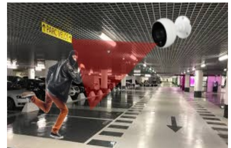
Détection des malveillances