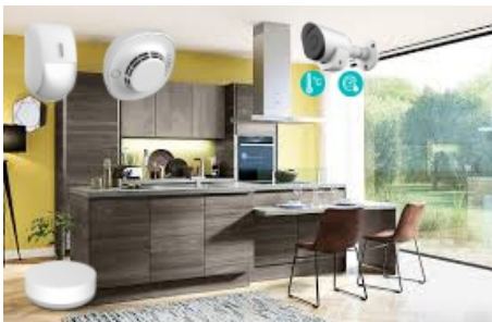
Gestion environnementale Protection domestique