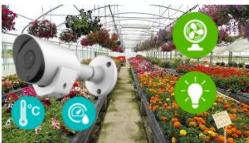
Gestion environnementale Protection des locaux commerciaux

La caméra passerelle permet le relais des signaux sans fil, elle doit être installée entre l'enregistreur numérique et les objets connectés tels que les détecteurs de mouvement, les capteurs d'inondation, les détecteurs d'ouverture de portes ou fenêtres, les détecteurs de fumées et, une ou plusieurs sirènes.