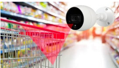
Analyse comportementale Protection des locaux commerciaux