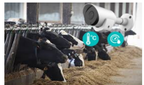
Bien être animal