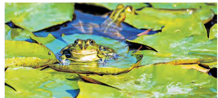
Direkt zu Beginn der Ferien können Kinder mehr über das Verhalten von Fröschen lernen.

Das gesamte Programm ist unter oekologiestation-bremen.de abrufbar. Für die meisten Veranstaltungen ist eine Voranmeldung unter 0421/222 19 22 oder unter info@oekologiestation-bremen.de erforderlich. (kh)