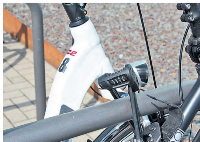
Klare Empfehlung: Das Fahrrad sollte an einen festen Gegenstand, wie einen Fahrradständer, angeschlossen werden.

Insbesondere in den warmen Monaten, wenn das Wetter gut ist und die Menschen viel mit dem Drahtesel