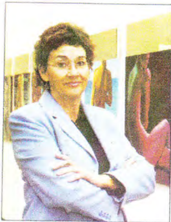
Puri del Palacio.