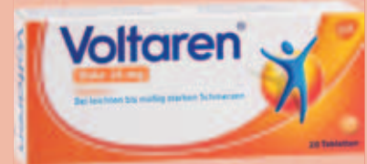
Voltaren Dolo 25 mg* 20 Tabletten

Wirkstoff: Chlorhexidinbis(D-gluconat). Anwendungsgebiete: Zur vorübergehenden Keimzahlverminderung im Mundraum. Unterstützung der Heilungsphase nach parodontalchirurgischen Eingriffen durch Hemmung der Plaque-Bildung, vorübergehenden unterstützenden Behandlung bei bakteriell bedingten Zahnfleischentzündungen (Gingivitis) und bei eingeschränkter Mundhygienefähigkeit.