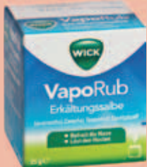
WICK VapoRub Erkältungssalbe* 25 g