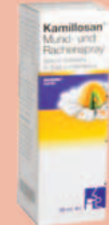
Kamillosan Mund- und Rachenspray* 30 ml