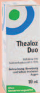
Thealoz Duo 10 ml

Wirkstoff: Diclofenac-Kalium. Anwendungsgebiete: Für Erwachsene und Jugendliche ab 14 Jahren. Zur Behandlung von leichten bis mäßig starken Schmerzen. Bei Schmerzen oder Fieber ohne ärztlichen Rat nicht länger anwenden als in der Packungsbeilage angegeben!