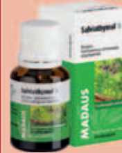
Salviathymol N Madaus* 20 ml

Anwendungsgebiete: Zur Anwendung bei Rachenentzündungen im Falle von nicht fieberhaften Erkältungskrankheiten sowie bei Schleimhautentzündungen der Mundhöhle und des Zahnfleisches, wie z. B.: Halsschmerzen, Schluckbeschwerden, leichte Mandelentzündungen, Gaumenentzündungen und Zahnfleischentzündungen/-reizungen. Enthält 25 Vol.-% Alkohol.