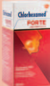
Chlorhexamed FORTE alkoholfrei 0,2 %* 300 ml

Anwendungsgebiete: Zur Besserung des Befindens bei Erkältungsbeschwerden der Atemwege (Schnupfen, Heiserkeit, Entzündung der Bronchialschleimhaut mit Symptomen wie Husten und Verschleimung).