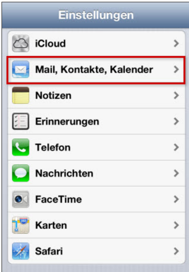
Menüpunkt Mail, Kontakte, Kalender