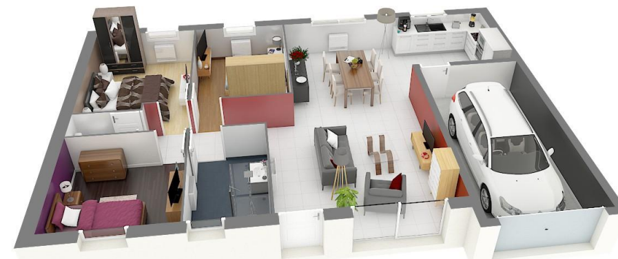
Vue en plan