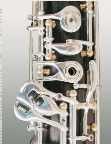
Option: Rollen an C/Cis/Es

Full automatic silver plated mechanism well seasoned and selected Grenadilla gold plated mechanism holders and rings gold plated octave vents Sterling silver bocal receiver, gold plated 2 Cocobolo bells, 2 gold plated bocals G-correction, adapting piece for low Bb B/C connection (switch off) new leather patent case plushlined leather cover option: roller keys for C/C#/Eb