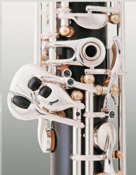
Rollen an C/Cis/Es