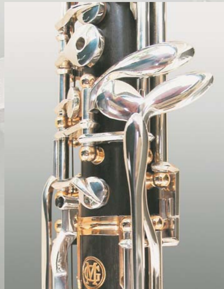
nach innen versetzter Schwenker