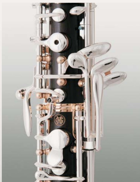
Einglassener linker Es-Heber