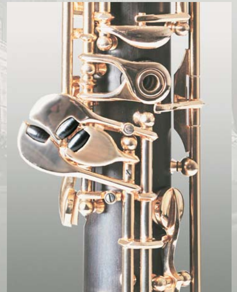
Option: Rollen an C/Cis/Es