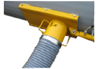
Hydraulische schuif onder de bak