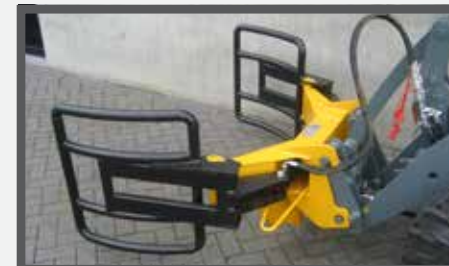
NL BALENKLEMMEN EN BALE CLAMPS DU BALLENZANGE FR GRIFFES POUR BALLES