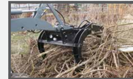
NL HOUTKLEMMEN HORIZONTAL EN WOOD CLAMPS HORIZONTAL DU HOLZKLEMMER HORIZONTAL FR GRIFFES À BOIS HORIZONTALES