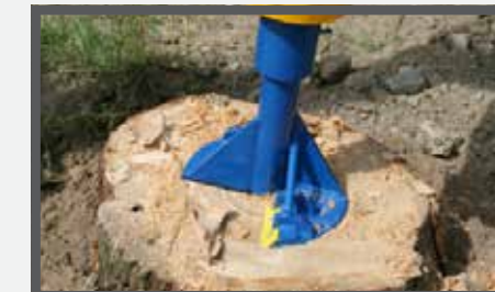
NL STOBENBOOR EN STUMP GRINDER DU BAUMSTUMPHÖHRER FR DÉRACINEUR DE SOUCHES