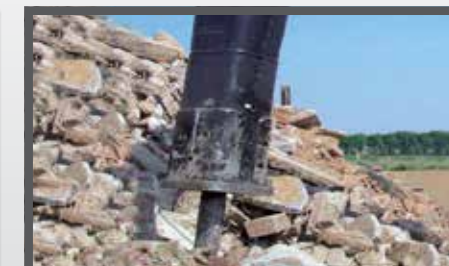
NL HYDR. SLOOPHAMER EN HYDR. SLEDGEHAMMER DU HYDR. BRECHER FR HYDR. BRISEUR