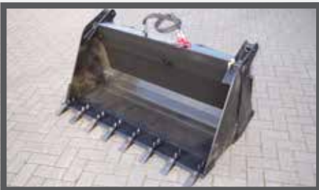
NL 4 IN 1 BAKKEN GELASTE TANDEN EN 4 IN 1 BUCKETS WELDED TEETH DU DROTTSCHAUFEL 4:1 GESCHWEIST REISSZÄHNE FR PELLES 4 EN 1 DENTS SOUDÉES