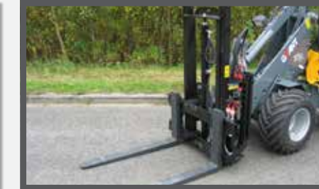
NL HEFMASTEN EN PALLET LIFT DU PALLETENHUBSTAPLER FR MÂTS DE LEVAGE