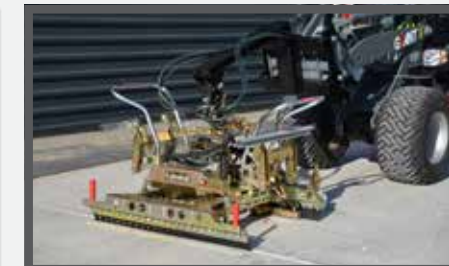
NL MACHINALE LEGKLEMMEN EN STONE INSTALLATION CLAMP DU PFLASTERVERLEGEZANGE FR GRIFFES DE DÉPÔT MACHINALES