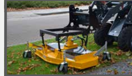
NL CIRKELMAAIERS EN ROTARY MOWERS DU SICHELMÄHER FR FAUCHEUSES ROTATIVES