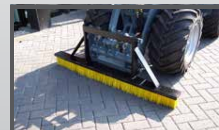
NL INVEEGBORSTELS EN BRUSH DU KEHRBÜRSTE FR BROSSES À BALAYER