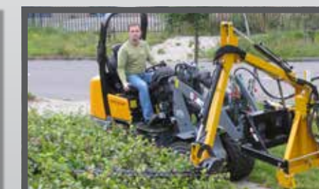
NL HEGGENSCHAAR EN HEDGE CUTTER DU HECKENSCHERE FR TAILLE-HAIE