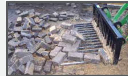
NL TEGELRIEKEN EN BROKEN STONE FORK DU STEINENGABEL FR FOURCHES À CARREAUX