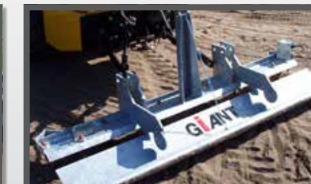
NL MANEGVLAKKERS EN LEVELLERS DU REITBAHNPLANER FR HERSES POUR MANÈGES