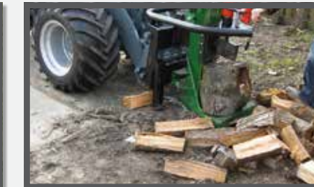
NL HOUTKLOOFMACHINE EN LOG SPLITTER DU HOLZSPALTER FR FENDEUSE À BOIS