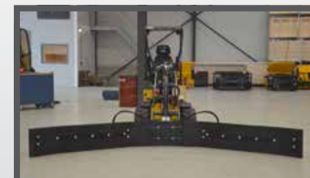
NL VOER- MESTSCHUIF COMPACT EN FEED- AND MANURESCRAPER COMPACT DU FUTTER- UND SCHMUTZSCHIEBER FR LAME À FOURRAGE - FUMIER COMPACT