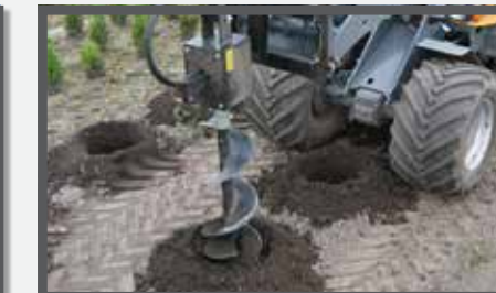
NL GRONDBOREN HYDR. EN HYDRAULIC EARTH DRILLS DU ERDBÖHRERÄT FR TARIÈRES HYDRAULIQUES