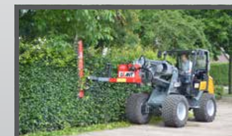
NL HEGGENSCHAAR EN HEDGE CUTTER DU HECKENSCHERE FR TAILLE-HAIE