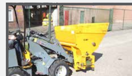
NL VERDEELBAKKEN COMPACT EN DIVIDE BUCKETS COMPACT DU VERTEILSCHAUFEL KOMPAKT FR BENNES DE DISTRIBUTION