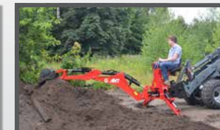
NL KRAANARM HYDR. EN EXCAVATOR ARM HYDR. DU BAGGERARM FR BRAS EXCAVATEUR