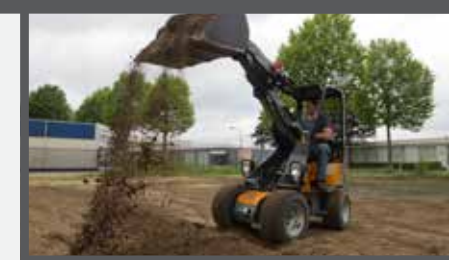
NL GRONDBAKKEN COMPACT EN EARTH BUCKETS COMPACT DU ERDSCHAUFEL KOMPAKT FR PELLES À TERRE COMPACT