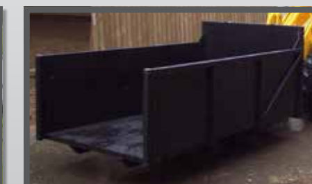
NL PAARDENMESTBAKKEN EN MANURE CONTAINER DU CONTAINERSCHAUFEL FR BENNES À FUMIER DE CHEVAL