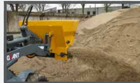
NL VERDEELBAKKEN (ZVDB) EN DIVIDE BUCKETS (ZVDB) DU VERTEILSCHAUFEL (ZVDB) FR BENNES DE DISTRIBUTION (ZVDB)