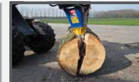
NL HOUTSPLIJTER EN LOG SPLITTER DU KEGELSPALTER FR FENDEUSE À BOIS