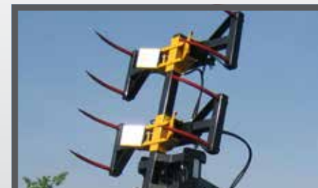
NL BALENGRIJPERS EN BALE CLAMPS WITH TEETH DU BALLENZANGE FR GRAPPINS POUR BALLES