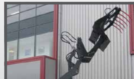
NL HOOGKIEP PELIKAANBAKKEN EN HIGH TIP PELICAN BUCKETS DU HOCHKIPP PELIKANSCHAUFEL FR BENNES PÉLIKAN BASCULANTES