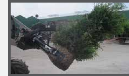
NL KLUITENKLEMMEN EN ROOT BALL CLAMPS DU WURZELBALLENKLEMMER FR GRIFFES À ARBRES