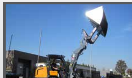
NL HOOGKIEPBAKKEN EN HIGH TIP PELICAN BUCKETS DU HOCHKIPPSCHAUFEL FR BENNES BASCULANTES