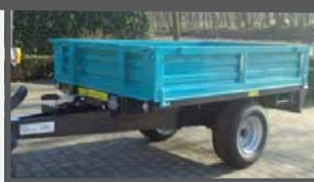
NL KIPPER EN TIPPING TRAILER DU KIPPANHÄNGER FR REMORQUE À BASCULE