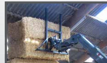
NL BALENVORKEN EN BALE FORKS DU BALLENSPIEß FR FOURCHES À BALLES