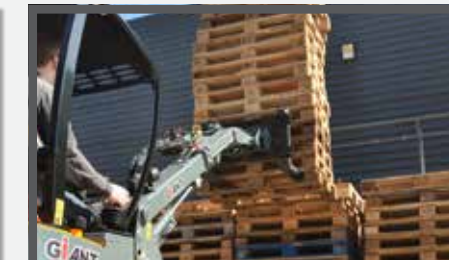
NL PALLETVORKEN COMPACT EN PALLET FORKS COMPACT DU PALETTEGABEL KOMPAKT FR FOURCHES À PALETTES COMPACT