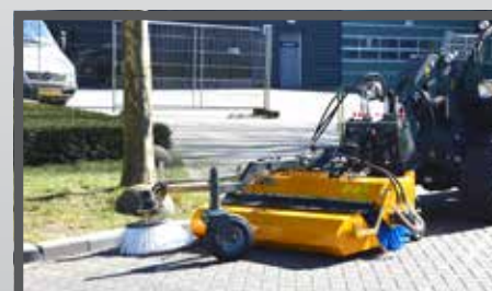
NL VEEGMACHINES EN SWEEPERS DU KEHRMASCHINEN FR BALAYEUSES