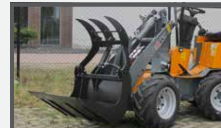
NL PELIKAANBAKKEN COMPACT EN PELICAN BUCKETS COMPACT DU PELIKANSCHAUFEL COMPACT FR BENNES PÉLIKAN COMPACT