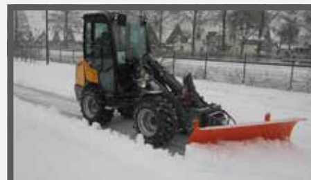
NL SNEEUWSCHUIVERS EN SNOW PLOWERS DU SCHNEERAUMSCHILD FR LAMES À NEIGE