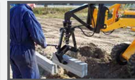
NL BANDENKLEMMEN EN STONELIFTER DU RANDSTEINZANGE FR GRIFFES POUR PNEUS