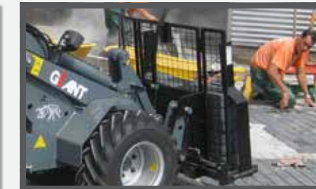
NL STENENKLEMMEN EN STONE CLAMPS DU STEINZANGE FR GRIFFES À PIERRES