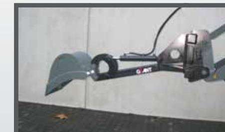
NL GRAAFARM EN DIGGER ARM DU BAGGERARM FR BRAS EXCAVATEUR