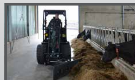
NL VOER- MESTSCHUIVEN EN FEED- AND MANURESCRAPER DU FUTTER- UND SCHMUTZSCHIEBER FR LAME À FOURRAGE - FUMIER