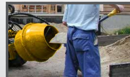
NL BETONMOLEN EN CONCRETE MIXER DU BETONIERMACHINE FR BÉTONNIÈRE