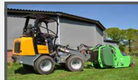
NL KLEPELMAAIERS MET OPVANGBAK EN FLAIL MOWERS WITH COLLECTOR DU SCHLEGELMULCHER MIT AUFNAHMBEHÄLTNER FR FAUCHEUSE À FLÉAU BENNE DE RÉCEPTION