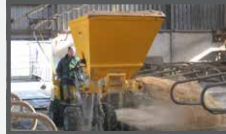
NL VERDEELBAKKEN (ZV) EN DIVIDE BUCKETS (ZV) DU VERTEILSCHAUFEL (ZV) FR BENNES DE DISTRIBUTION (ZV)