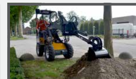
NL GRAAFARM COMPACT EN DIGGER ARM COMPACT DU BAGGERARM KOMPAKT FR BRAS EXCAVATEUR COMPACT