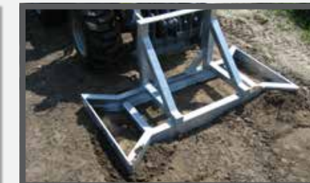
NL EGALISATIEFRAMES EN LEVELLING FRAME DU PFLASTERVERLEGEZANGE FR CADRES D'ÉGALISATION