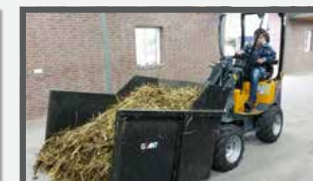
NL MEST CONTAINER COMPACT EN MANURE CONTAINER COMPACT DU CONTAINERSCHAUFEL KOMPAKT FR BENNES À FUMIER DE CHEVAL