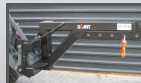
NL JIPPEN EN JIB BOOMS DU AUSLEGARM FR BRAS RADIAUX