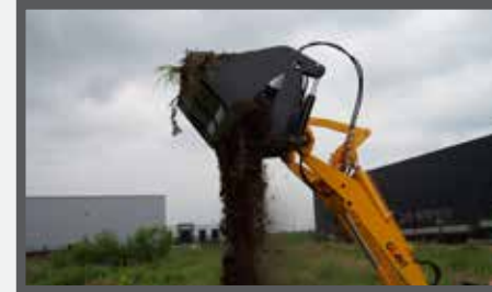
NL 4 IN 1 BAKKEN EN 4 IN 1 BUCKETS DU DROTTSCHAUFEL 4:1 FR PELLES 4 EN 1