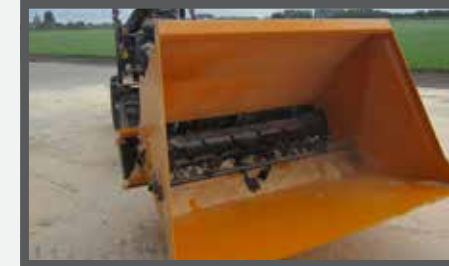
NL VERDEELBAKKEN (MVB) EN DIVIDE BUCKETS (MVB) DU VERTEILSCHAUFEL (MVB) FR BENNES DE DISTRIBUTION (MVB)