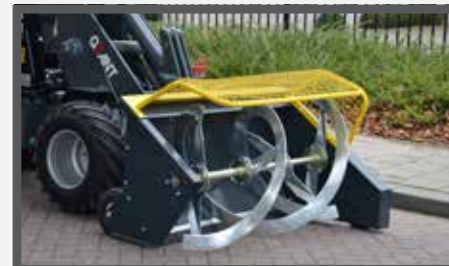
NL VOERVIJZEL EN FOOD AUGER DU FUTTERAUFBEREITER FR L'UNITÉ DE PRÉPARATION DU FOURRAGE