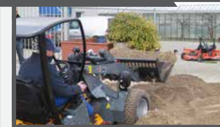
NL PUINBAKKEN COMPACT EN WASTE BRICK BUCKETS COMPACT DU SCHUTTSCHAUFEL FR BENNES À GRAVATS COMPACT