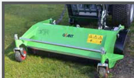
NL KLEPELMAAIERS EN FLAIL MOWERS DU SCHLEGELMULCHER FR FAUCHEUSE À FLÉAU