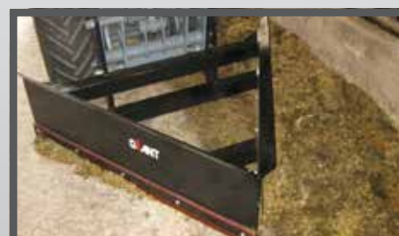
NL VOER- MEST PIJLSCHUIF EN FEED- AND MANURESCRAPER DU FUTTER- UND SCHMUTZSCHIEBER FR LAME À FOURRAGE - FUMIER