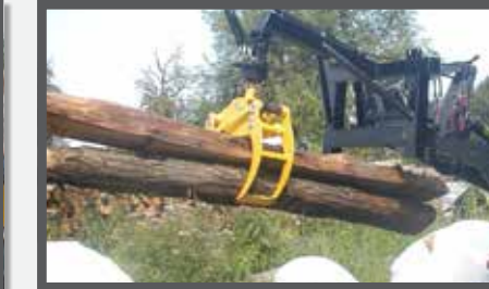
NL HOUTKLEMMEN EN WOOD CLAMPS DU HOLZKLEMMER FR GRIFFES À BOIS