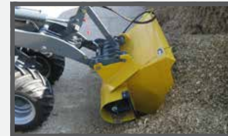
NL VOERBAKKEN EN FEED BUCKETS DU FUTTERDOSIERGERÄT FR BENNES À FOURRAGE