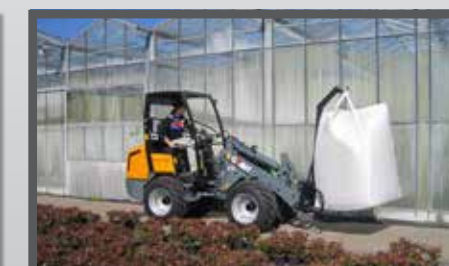
NL BIG BAG HAARKARMEN EN BIG BAG LIFTING ARMS DU BIG BAG HAKEN FR BRAS À CROCHETS POUR BIG BAGS