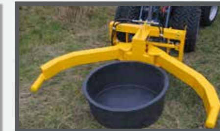
NL POTTENKLEMMEN EN POT CLAMPS DU GREIFZANGE FR GRIFFES À POTS