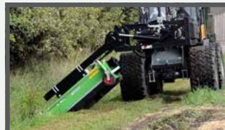
NL KLEPELMAAIERS ZIJANBOUW EN FLAIL MOWERS SIDE ATTACHMENT DU SCHLEGELMULCHER SEITENANBAU FR FAUCHEUSE À FLÉAU MONTAGE LATÉRAL