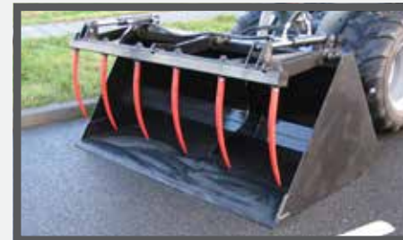
NL VOLUME BAKKEN MET KLEM EN HIGH VOLUME BUCKETS WITH CLAMP DU LEICHTGUTSCHAUFEL MIT ZANGE FR BENNES POUR VOLUME, AVEC GRIFFE