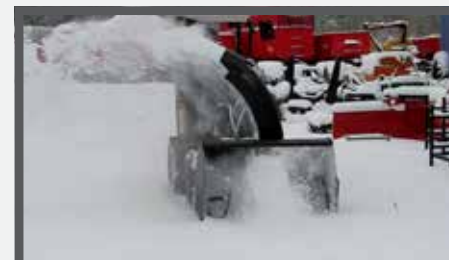
NL SNEEUWFREES EN SNOW PLOWERS DU SCHNEEFÄHRE FR SOUFFLEUSE À NEIGE