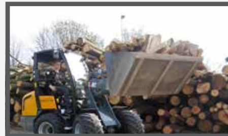
NL VOLUME BAKKEN EN HIGH VOLUME BUCKETS DU LEICHTGUTSCHAUFEL FR BENNES POUR VOLUME