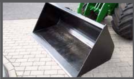
NL GRONDBAKKEN EN EARTH BUCKETS DU ERD SCHAUFEL FR PELLES À TERRE