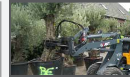
NL BOMENKLEMMEN EN TREE CLAMPS DU BAUMKLEMMER FR GRIFFES À ARBRES