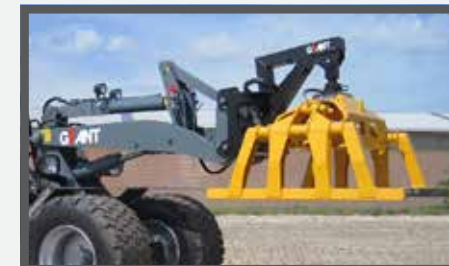
NL PAKKENKLEMMEN EN STONE CLAMP DU STEINZANGE FR GRIFFE À PAQUETS