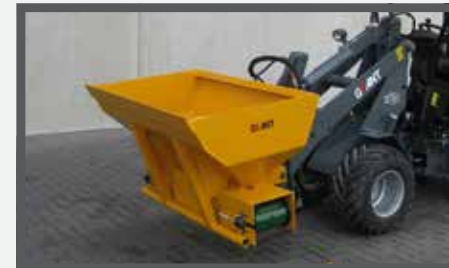
NL DIEPSTROOISELBAKKEN (DSB) EN DEEP-LITTER BUCKETS (DSB) DU TIEFSTREUSCHAUFEL (DSB) FR ÉPANDEURS PROFONDS (DSB)