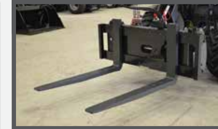
NL PALLETVORKEN SIDESHIFT EN PALLET FORKS SIDESHIFT DU HYDRAULISCHE PALETTEGABEL FR FOURCHES À PALETTES HYDRAULIQUE