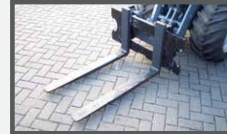
NL PALLETVORKEN EN PALLET FORKS DU PALETTEGABEL FR FOURCHES À PALETTES