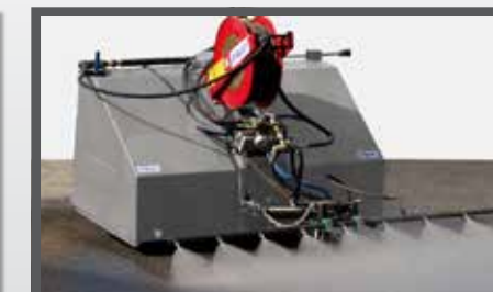
NL STRAATREINIGINGS UNIT EN STREET WASHING UNIT DU STRASSENREINIGUNGSANLAGE FR UNITÉ DE LAVAGE DE LA VOIRIE