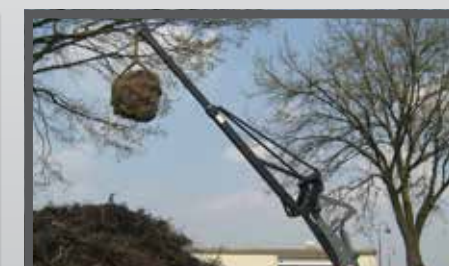
NL HIJSBOKKEN EN LIFTING ARMS DU KRANARM FR BLOCS DE HISSAGE