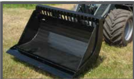
NL PUINBAKKEN EN WASTE BRICK BUCKETS DU SCHUTTSCHAUFEL FR BENNES À GRAVATS