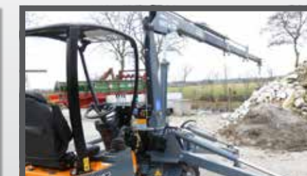
NL KRAAN ARM COMPACT EN CRANE ARM COMPACT DU KRANARM KOMPAKT FR GRUE BRAS COMPACT

ANY GIANT ATTACHMENT CAN BE FITTED WITH A COMPACT HITCH