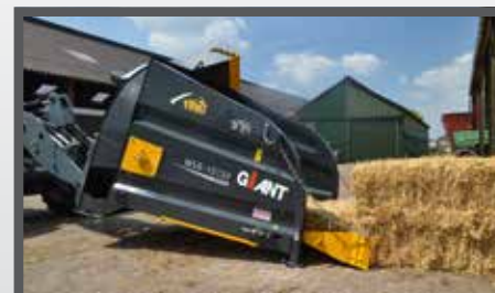
NL STROBLAZERS EN STRAWBLOWERS DU STROHGEBLÄSE FR SOUFFLEURS DE PAILLE