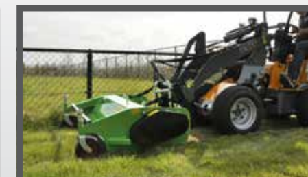
NL KLEPELMAAIERS COMPACT EN FLAIL MOWERS COMPACT DU SCHLEGELMULCHER KOMPAKT FR FAUCHEUSE À FLÉAU COMPACT