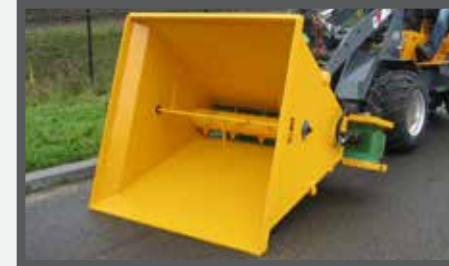
NL VERDEELBAKKEN (VDB) EN DIVIDE BUCKETS (VDB) DU VERTEILSCHAUFEL (VDB) FR BENNES DE DISTRIBUTION (VDB)