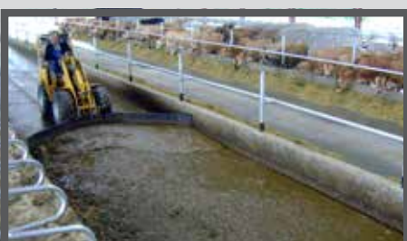
NL VOER- MESTSCHUIVEN EN FEED- AND MANURESCRAPER DU FUTTER- UND SCHMUTZSCHIEBER FR LAME À FOURRAGE - FUMIER