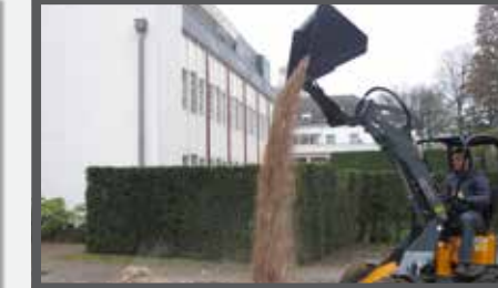
NL HOOGKIPBAKKEN COMPACT EN HIGH TIP BUCKETS COMPACT DU HOCHKIPPSCHAUFEL KOMPAKT FR BENNES BASCULANTES COMPACT