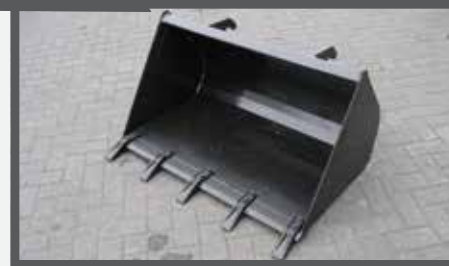
NL GRONDBAKKEN MET GESCHROEFDE TANDEN EN EARTH BUCKETS WITH BOLTED TEETH DU ERD SCHAUFEL MIT GESCHRAUBT REISSZÄHNE FR PELLES À TERRE DENTS VISSÉES