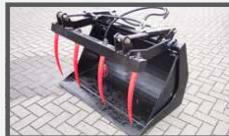
NL PUINBAKKEN MET KLEM EN WASTE BRICK BUCKETS WITH CLAMP DU SCHUTTSCHAUFEL MIT ZANGE FR BENNES À GRAVATS, AVEC GRIFFE