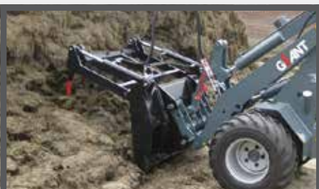
NL MESTVORKEN EN MANURE FORKS DU DUNG- UND SILLAGEZANGE FR FOURCHES À FUMIER