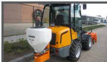
NL ZOUTSTROOIERS EN SALT SPREADERS DU STREUER FR ÉPANDEURS DE SEL