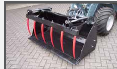
NL PELIKAANBAKKEN EN PELICAN BUCKETS DU SCHUTTSCHAUFEL FR BENNES PÉLIKAN