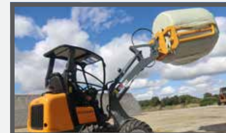
NL BALENKLEMMEN EN BALE CLAMPS DU BALLENZANGE FR GRIFFES POUR BALLES