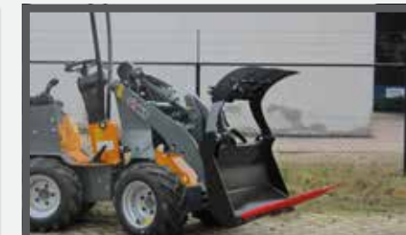
NL MESTVORKEN MET KLEM COMPACT EN MANURE FORKS WITH CLAMP COMPACT DU DUNG- UND SILLAGEZANGE KOMPAKT FR FOURCHES À FUMER, AVEC GRIFFE