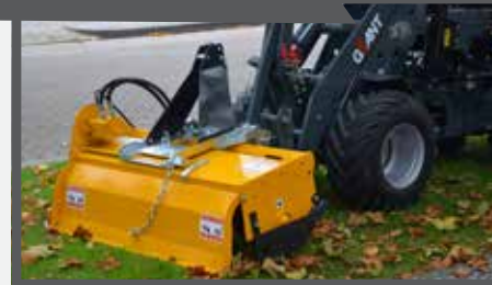
NL GRONDFREES EN ROTARY TILLER DU BODENFRÄSE FR FRAISE