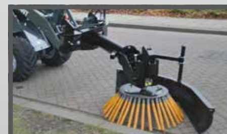
NL ONKRUIDBORSTELS EN WEED BRUSH DU WILDKRAUTBÜRSTE FR BROSSES POUR MAUVAISES HERBES