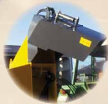
30° zijdelingse uitgang Sortie latérale 30°