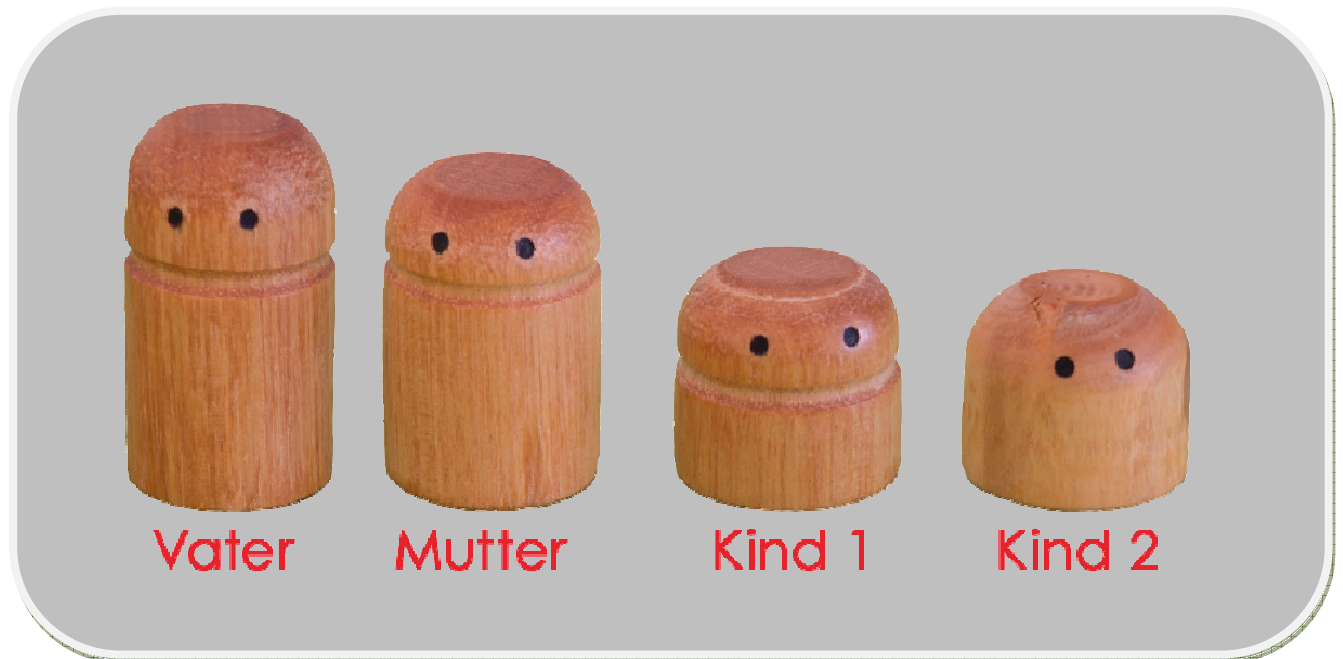
Schaubild 2: Reguläre Reihenfolge

Wichtig ist die Blickrichtung der Personen, um auch die Herzensseite bestimmen zu können.