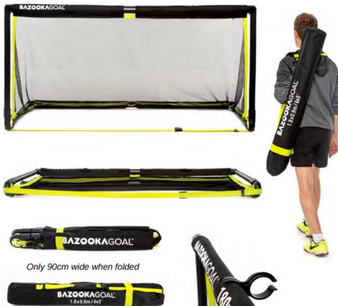
Only 90cm wide when folded

Bazookagoal 180x90 ist unser größtes Tor und führt die neue FLIP-Crossbar-Faltfunktion ein, die ein super-kompaktes faltformat für Transport und Lagerung bietet.