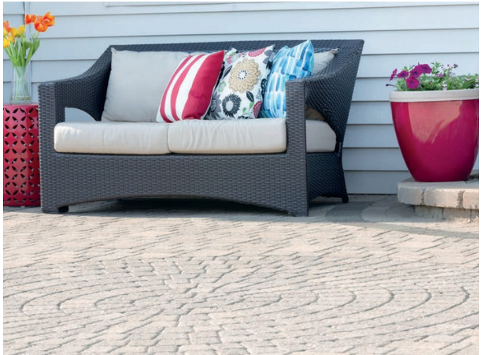
Stand: Mai 2019

Wenn Herbstlaub, Grasschnitt vom Rasenmähen oder Düngerreste anfallen, sollten Sie ihrer Terrasse bzw. ihren befestigten Flächen besondere Aufmerksamkeit schenken. Durch die Zersetzung und den Abbau der organischen Substanz aus Laub oder Gras entstehen Gerbsäuren, die in die Steinoberfläche einziehen und zu unschönen Verfärbungen führen können. Diese Verfärbungen sind unter Umständen dauerhaft und lassen sich häufig nur mit erheblichem Aufwand beseitigen bzw. vermindern.