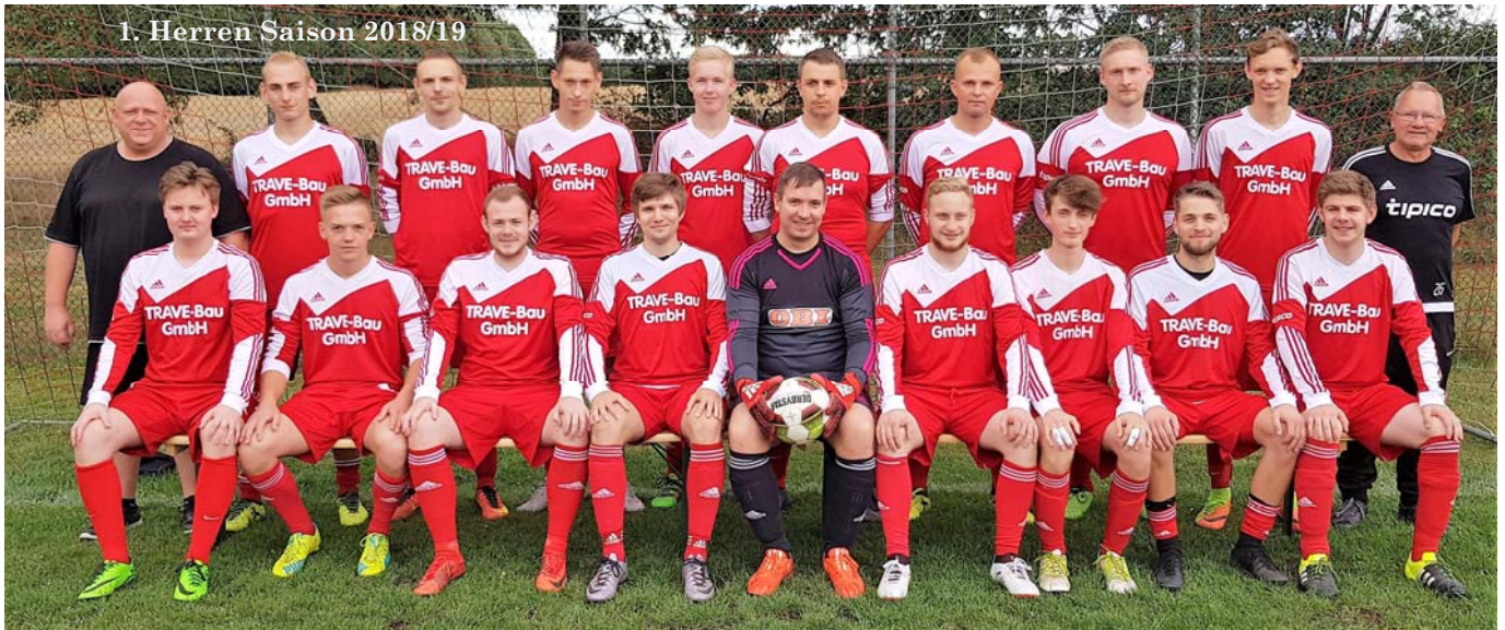
1. Herren Saison 2018/19

Nach dem Neustart in der letzten Saison unter Cheftrainer Dietmar Krebs und Co-Trainer Manfred Arps, in der durch die Spielklassenreform neu gegründeten Kreisklasse C, befindet sich unsere 1. Herren weiterhin im Aufwind.