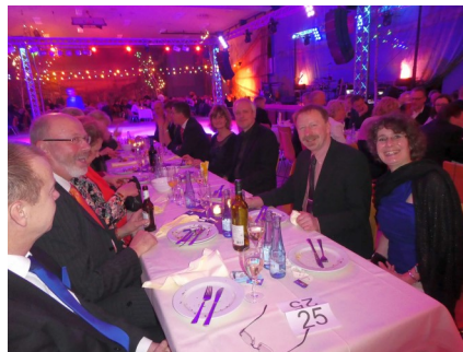
Die Tanzriege des Tralauer SV genießt den Ausflug auf den Feuerwehrball in Reinfeld.

Grünkohlessen zu versorgen - und die Tische später wieder abzuräumen. Zeitgleich gibt es die Möglichkeit, sein Glück bei der Tombola des Fördervereins zu versuchen und einen der vielen kleinen und größeren Preise, oder sogar den Hauptpreis, ein Wochenendtrip für 2 Personen nach Berlin, zu gewinnen. Getränke können ent-