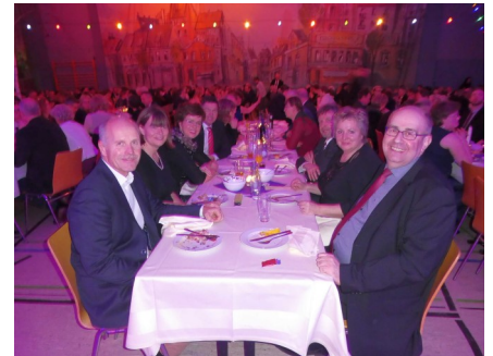
600 Gäste stärkten sich zu Beginn bei Grünkohl und Röstkartoffeln. Hernach wurden die Kalorien abgetanzt.

Die Tralauer Tanzpaare hatten einen unglaublich schönen Abend mit viel Spaß bei Cha-Cha-Cha, Rumba, Walzer, Disco-Fox und brachten auch et-