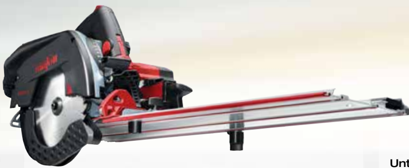
Kappschiene-Säge KSS 50 18M bl im Transportkoffer Art.Nr.: 919301