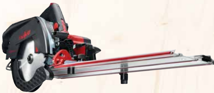
Kappschiene-Säge KSS 50 cc im Transportkoffer Art.Nr.: 918902