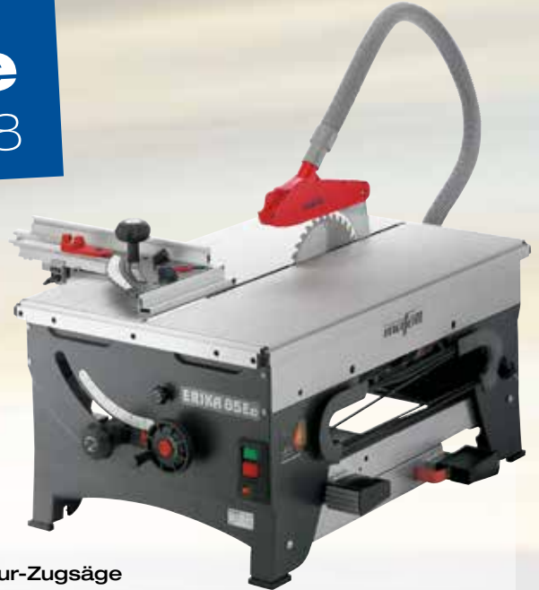
Unterflur-Zugsäge ERIKA 85 Ec Paket Art.Nr.: 971650