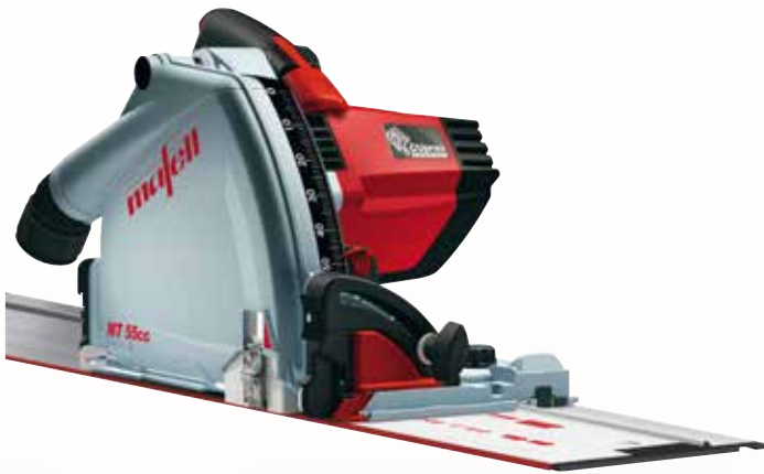
Tauchsäge MT 55 cc MidiMAX im T-MAX mit F 160 Art.Nr.: 917613