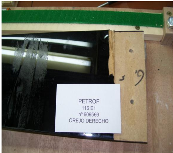
1º Orejo derecho arrancado y dañado