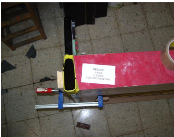
5º Gota de poliéster