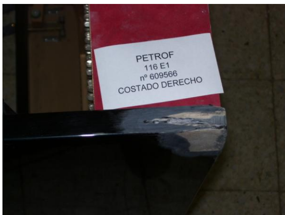
3º Pegado y listo para la gota