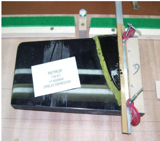
3º Gota de poliéster echada y cuajada