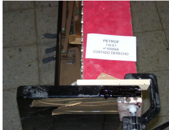
2ª Como pegar las capas de material