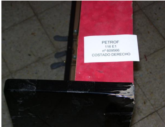
1º Costado dañado