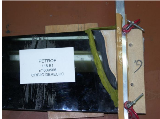
2º Preparado para la gota