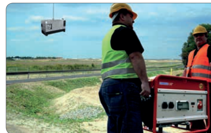
Groß und schwer war gestern - klein und leicht ist heute

Durch die Schutzart IP54 werden Generatoren vor kleinsten Staubpartikeln und Spritzwasser geschützt. Dies erhöht nicht nur die Lebensdauer Ihres Stromerzeugers, sondern stellt in erster Linie auch einen Schutz für die damit arbeiteten Personen dar.