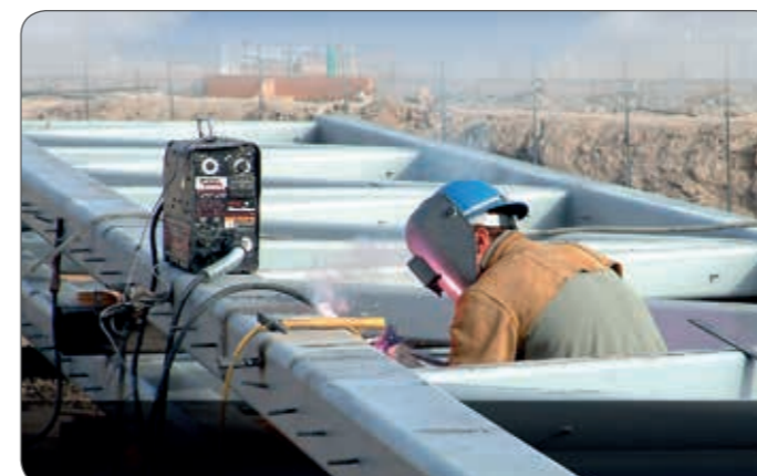
Nur DUPLEX-Stromerzeuger geben Ihnen die Garantie, dass keine Schiefast auftreten kann

Einzigartig in seiner Klasse - für mehr Mobilität.