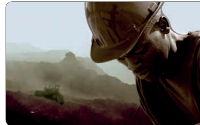
Alle DUPLEX-Stromerzeuger werden mit IP 54 gebaut - für Ihre Sicherheit

Mehr Sicherheit durch IP 54. Warum ist IP 54 so wichtig?