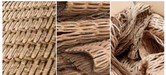
Das Verpackungspolster ist beliebig einsetzbar und schützt Gegenstände optimal – als Polstermatte, als Polsterwickel oder zum Füllen von Hohlräumen.