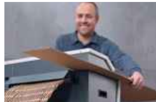
Das Zuschneiden und Aufpolstern erfolgt in einem Arbeitsgang