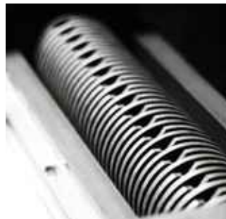
Spezialgehärtete Schneidwellen für absolut präzise Schnittführung.