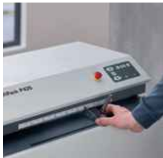
Die Maßskala ermöglicht ein einfaches Einstellen der gewünschten Materialbreite.