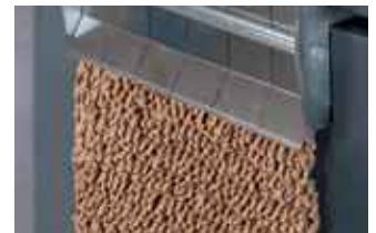
Herstellung von verdichtetem Füllmaterial mit geschlossener Stauchungsklappe (HSM ProfiPack P425).