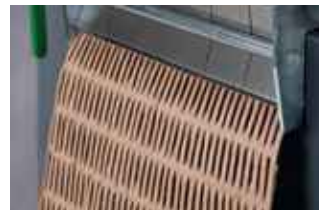
Herstellung von Polstermatten (HSM ProfiPack P425).