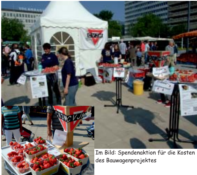
Im Bild: Spendenaktion für die Kosten des Bauwagenprojektes