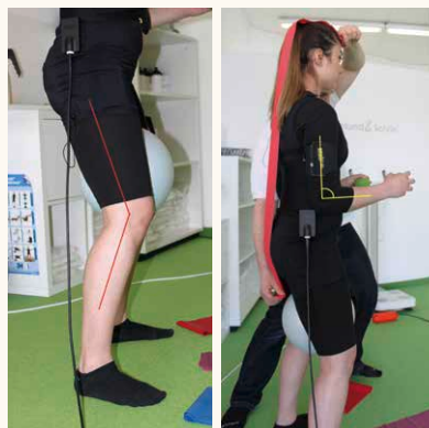
Korrekte Haltung und Ausrichtung der Beine/Fußstellung (links) sowie Belastung von Vorfuß und Ferse, korrekte Haltung von Rücken und Armstellung (rechts)