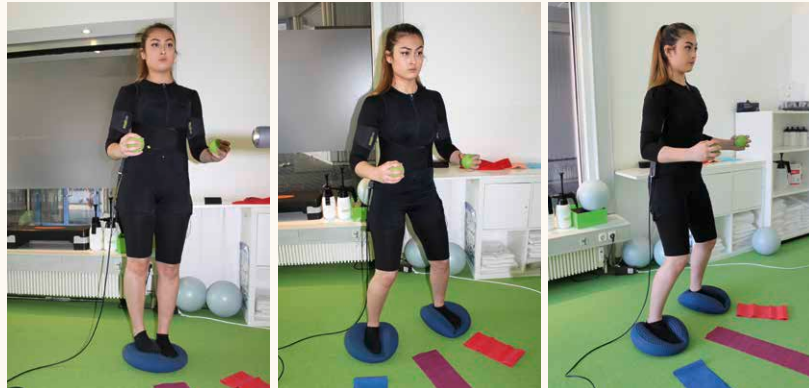
Unterschiedliche Schwierigkeitsgrade bei gleicher (korrekter) Haltung bei allgemeinem Beckenbodentraining