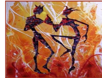
Werkbeispiel des Künstlers

Der Workshop ermöglicht uns einen Einblick in seine handwerklichen Techniken und lässt uns seine Freude am Experiment mit teils