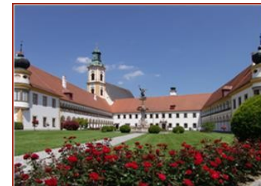
Unterkunft Stift Reichersberg

gewagten Materialkombinationen miterleben. Entdecken Sie in besonderer Atelieratmosphäre und angeregt durch die Arbeit mit den Materialien Glas, Holz und Farbe Ihre eigene Kreativität.