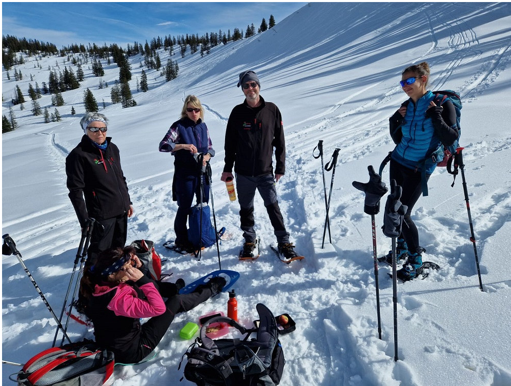
Schneeschuhwanderung am 09.03.24 in Grasgehren