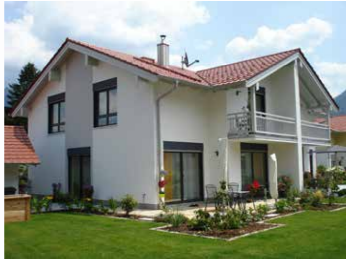
Doppelhaus in Fischbach