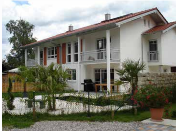
Doppelhaus in Brannenburg mit Wendelsteinblick