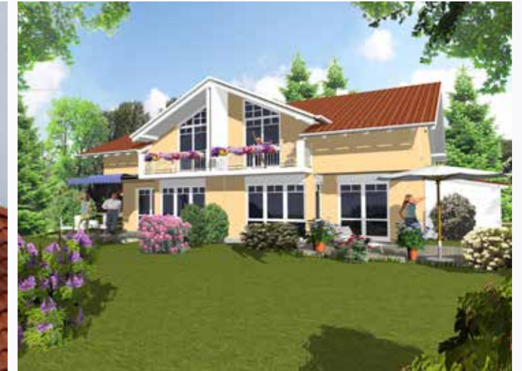
3-D Visualisierung eines Doppelhauses in Schechen