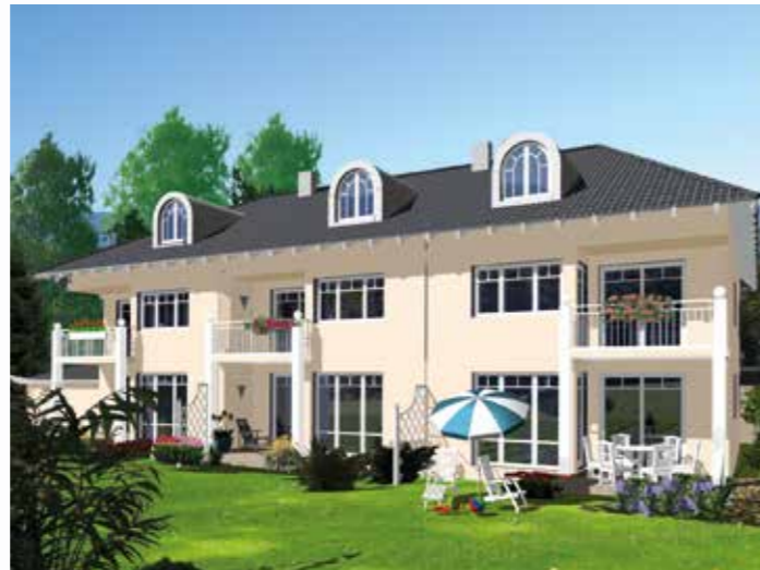
3-D Visualisierung eines 3 Späners in Rosenheim