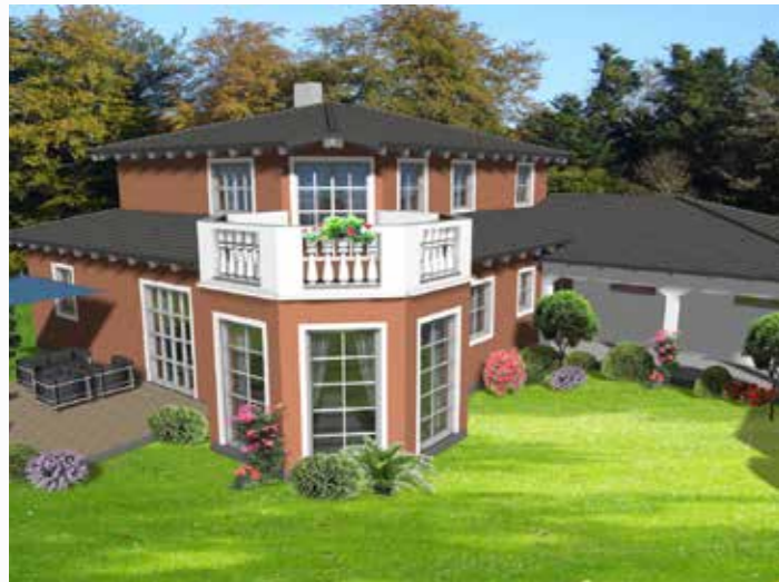
3-D Visualisierung eines Einfamilienhauses in Fürstenfedbruck