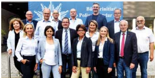
Vorstand Pro Polizei Wetzlar

Die Uhrzeiten für den An- und Abflug des Eurocopters der Hessischen Polizei sowie Vorführung des Spezialeinsatzkommandos (SEK) werden aufgrund der aktuellen Lage (Fußball EM) erst kurzfristig erfolgen können. Daher sind Änderungen im Programm jederzeit möglich.