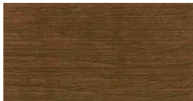
DEMIDEKK 90000 TERRASSEBRUN