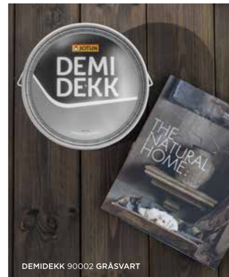
DEMIDÉKK 90002 GRÅSVART

Om een goede kleurkeuze te maken voor het terras is het van belang te kijken naar de omgeving. Zorg dat de kleur overeenkomt met de hoofdkleur van het huis of de natuurlijke omgeving. Het belangrijkste is het om een kleur te kiezen die sfeer geeft tijdens de mooie zomerdagen.