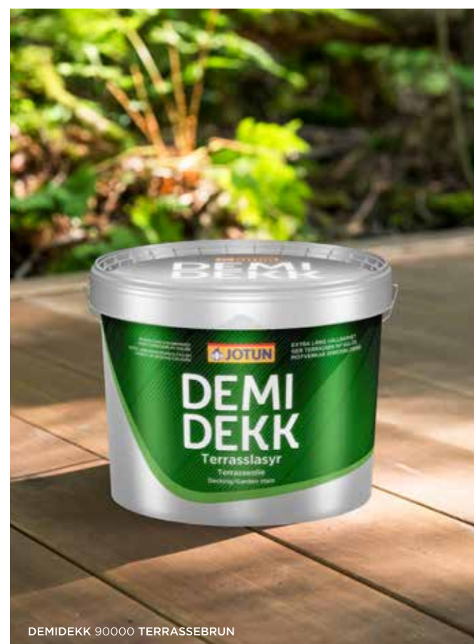
DEMIDEKK 90000 TERRASSEBRUN