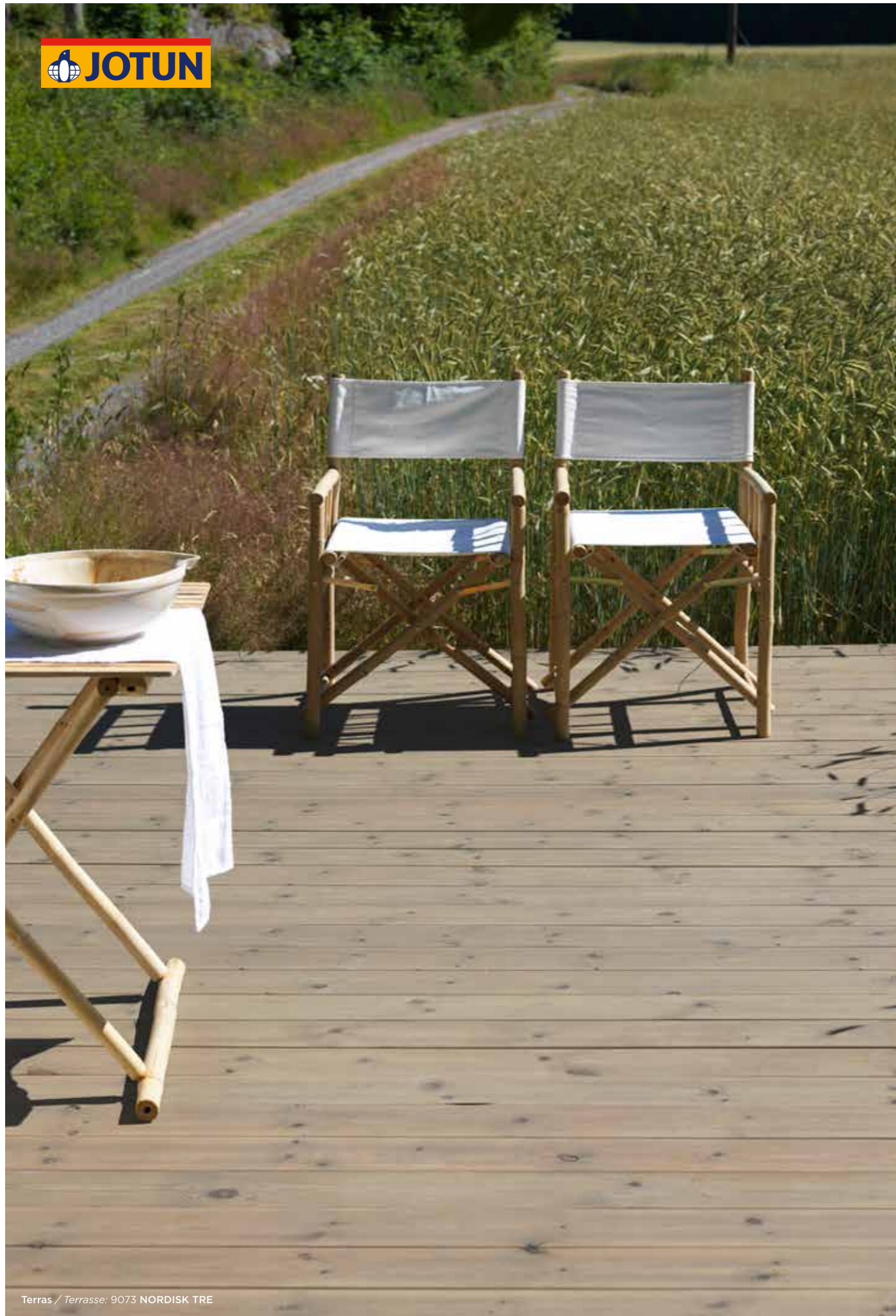
Terras / Terrasse: 9073 NORDISK TRE