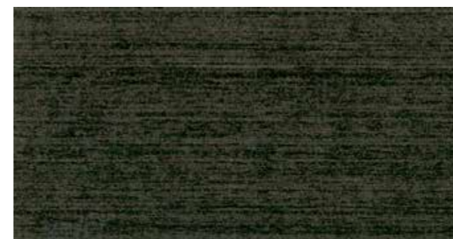
DEMIDEKK 0683 SOTGRÅ