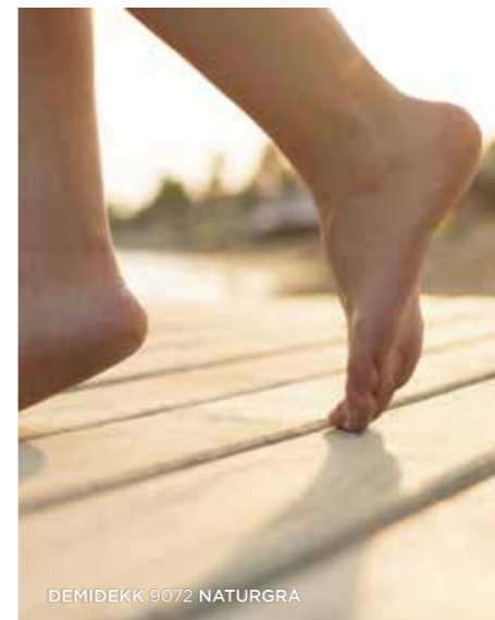
DEMIDÉKK 9072 NATURGRA