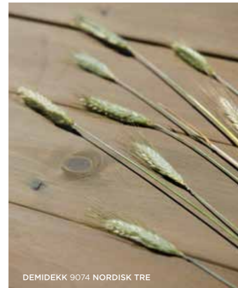
DEMIDÉKK 9074 NORDISK TRE