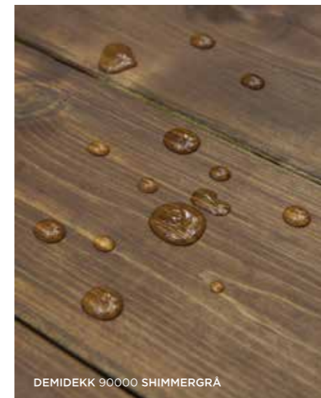
DEMIDEKK 90000 SHIMMERGRÅ

Le DEMIDEKK TERRASSLASYR 'nouvelle formule' protège encore mieux votre terrasse contre les algues et les moisissures.