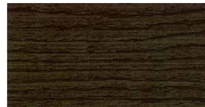
DEMIDEKK 90002 GRÅSVART