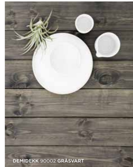
DEMIDÉKK 90002 GRÅSVART