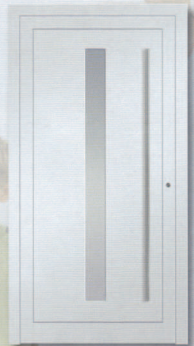
AluKompakt 10 Glas Satinato weiß beidseitig rahmenlos Edelstahlgriffstange