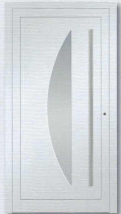
AluKompakt 8 Glas Satinato weiß beidseitig rahmenlos Edelstahlgriffstange