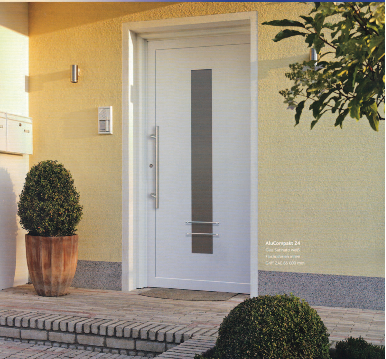
AluKompakt 24 Glas Satinato weiß Flachrahmen innen Griff ZAE 6S 600 mm