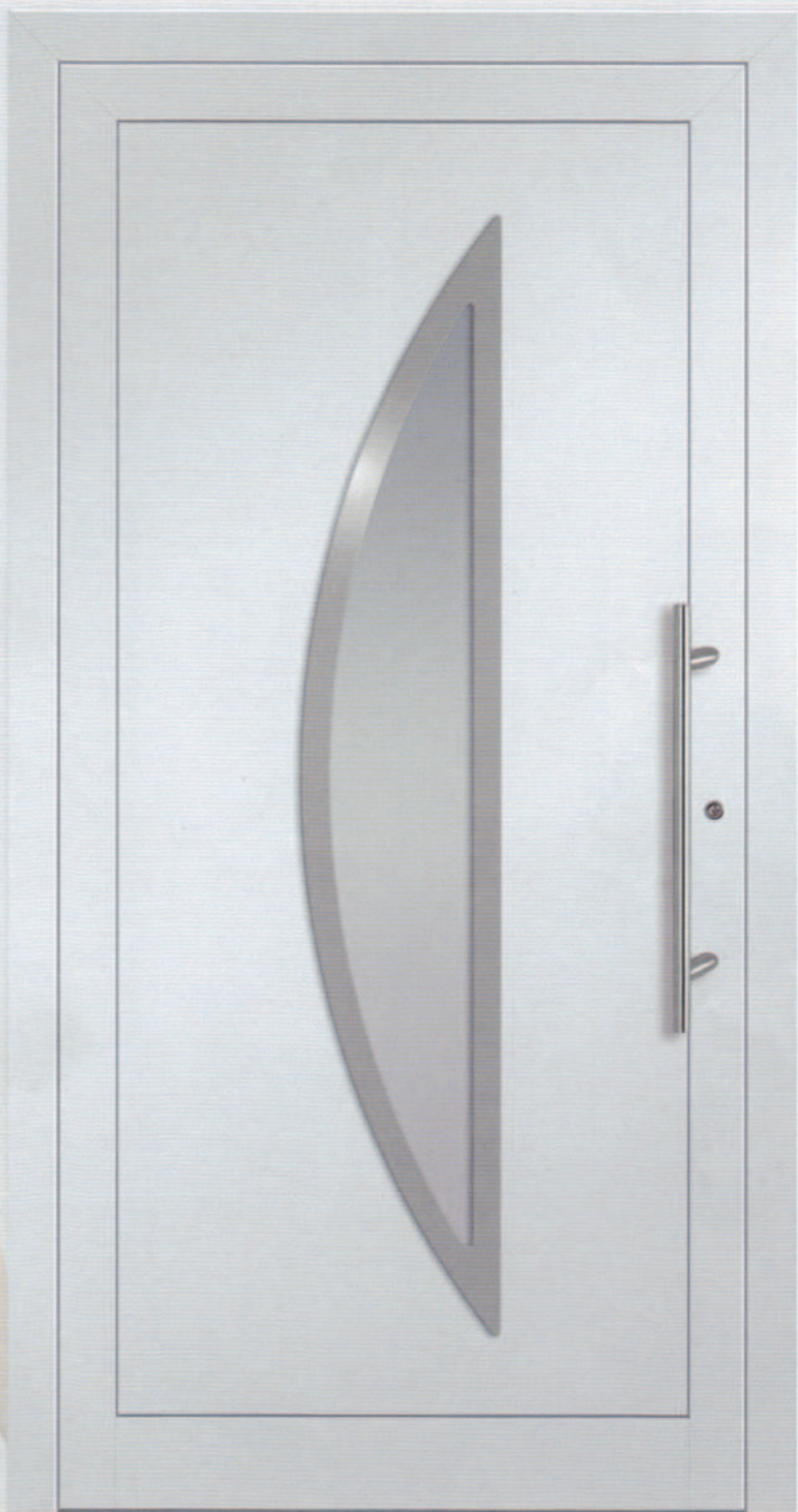
AluCompakt 22 Glas Satinato weiß Edelstahlrahmen beidseitig Griff ZAE 65 600 mm