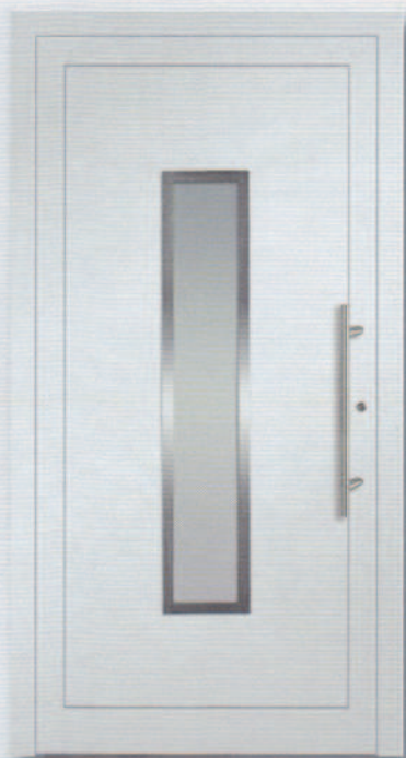
AluCompakt 23 Glas Satinato weiß Edelstahlrahmen beidseitig Griff ZAE 65 600 mm