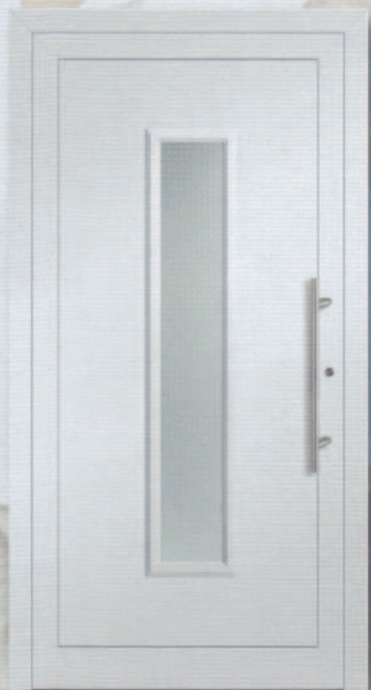
AluCompakt 21 Glas Mastercarré weiß Ornamentrahmen beidseitig Griff ZAE 65 600 mm