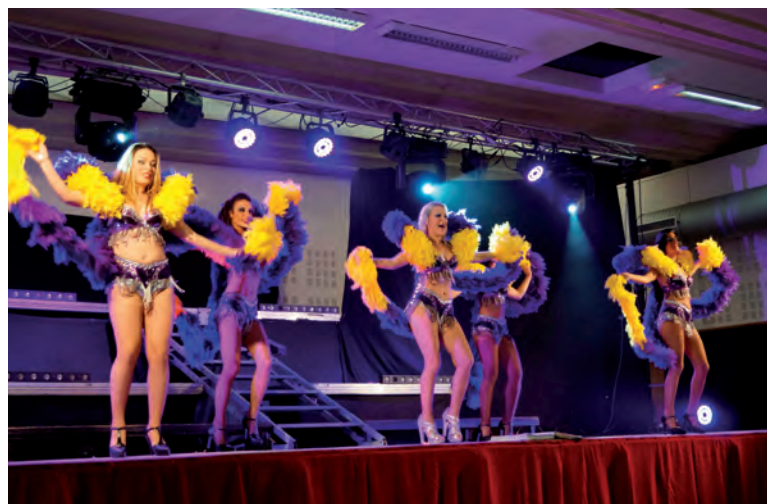
Un repas et un spectacle appréciés par tous !!!

Rendez-vous est pris pour l'année prochaine.