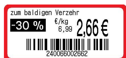
Preis- und Strichcode auf Kombi-Etikett

Preis- und Strichcodeetikett separat, für Ober- und Unteretikettierung