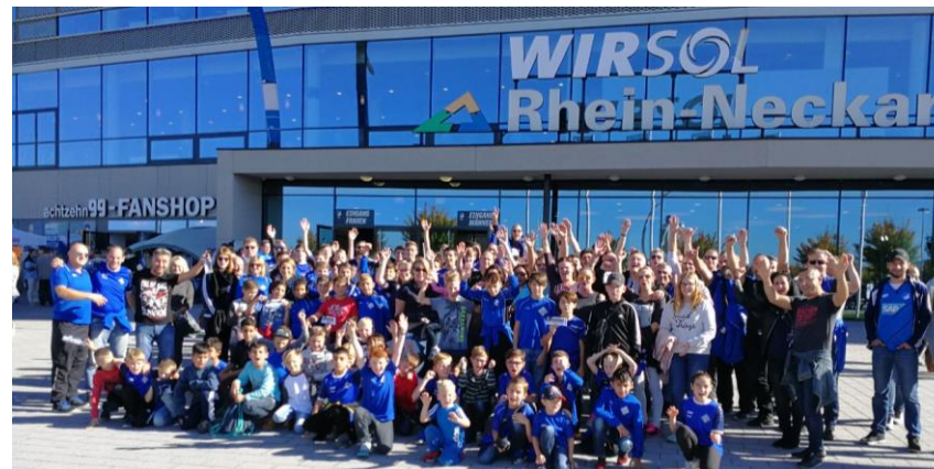
Besuch des Bundesligaspiels TSG Hoffenheim – FC Augsburg (2017)