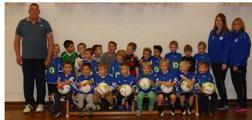
Für Nachwuchs ist gesorgt 😊