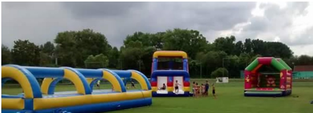
Sommerfest der Jugendabteilung mit vielen Attraktionen (2019)