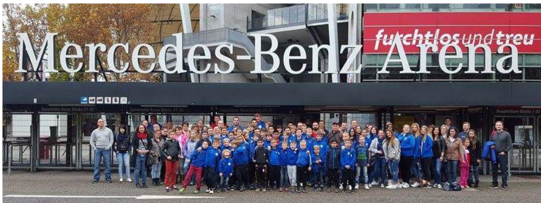
Ausflug der Jugendabteilung in die Mercedes Benz Arena (2016)