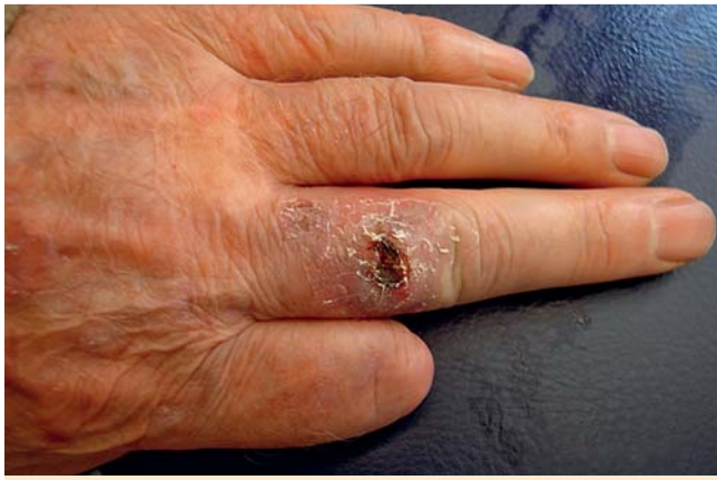
Abb. 1 Befund Tag 0: ulzerierter Tumor.