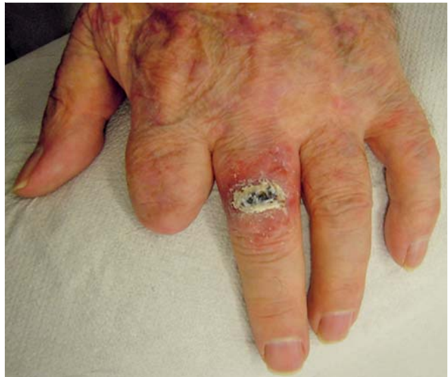
Abb. 3 Befund Tag 20: typische Lackreste nach Actikerall®.

Die Häufigkeit der aktinischen Keratose (AK) und des hellen Hautkrebses in der weißen Bevölkerung steigt weltweit dramatisch. 82% der nicht-melanozytären Tumore gehen von AKs aus [7,10]. Genaue Zahlen für Deutschland liegen nicht vor, da nicht-melanozytäre Tumoren von den meisten Krebsdatenbanken noch nicht vollständig erfasst werden. Die Kommission Hautkrebs-Screening Deutschland geht von über 100 000 Neuerkrankungen bei einer Inzidenz von 140/100 000 für Männer und 100/100 000 für Frauen aus [11]. Im Krebsregister Schleswig-Holstein stellten 2004 nicht-melanozytäre Hauttumoren bei Männern mit 22,63% und bei Frauen mit 23,75% die häufigste Krebsart dar [11]. Die AKs als Carcinoma in situ sind bei hoher Dunkelziffer noch wesentlich häufiger. Bei bis zu 20% der Betroffenen kommt es zu einem schleichenden Übergang in Plattenepithelkarzinome (SCC), bei Immunsupprimierten sogar in bis zu 60% [3]. In seltenen Fällen kann es beim SCC zum Auftreten von lymphogenen