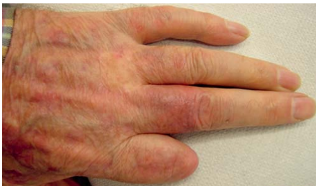
Abb. 6 Befund Tag 60: nur noch leichtes Resterythem.