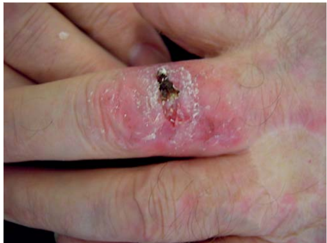
Abb. 4 Befund Tag 20: nach Abtragen des Detritus.