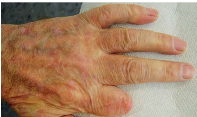
Abb. 7 Befund Tag 294: Resitutio ad integrum – Langzeitergebnis.