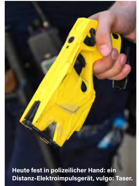
Heute fest in polizeilicher Hand: ein Distanz-Elektroimpulsgerät, vulgo: Taser.

vorerst auch nicht zu erwarten. Und das, so wage ich an dieser Stelle zu behaupten, ist auch gar kein Problem. Sinnvolle Nutzungsszenarien des Tasers sind, zumindest aus deutscher Sicht, vergleichsweise rar, Kosten und Wirkung hingegen klare Schwachpunkte des Systems.