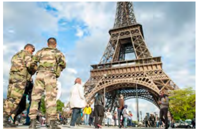
In Ländern wie Frankreich ein normales Bild: Militär zum Schutz der Bevölkerung, allein auf Streife oder in Zusammenarbeit mit der Polizei.

Jetzt könnte man natürlich argumentieren, dass in einem solchen Fall die Polizei halt von der Bundeswehr ausgestattet wird – Fahrzeuge, Waffen, Munition – und schon kann die rechtskonforme Bekämpfung dieser Terrortruppe beginnen. Doch selbst dann würden Ausbildung und – vor allem – Mindset wohl noch fehlen. Es sei denn, man wäre bereit, diesen etwas ungleichen Kampfeinzu-