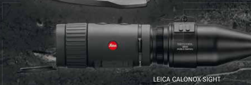
LEICA CALONOX SIGHT