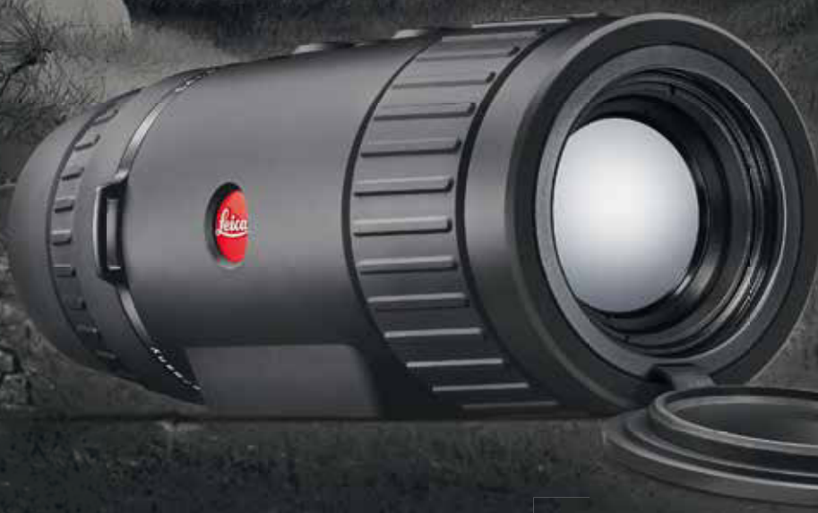
LEICA CALONOX VIEW