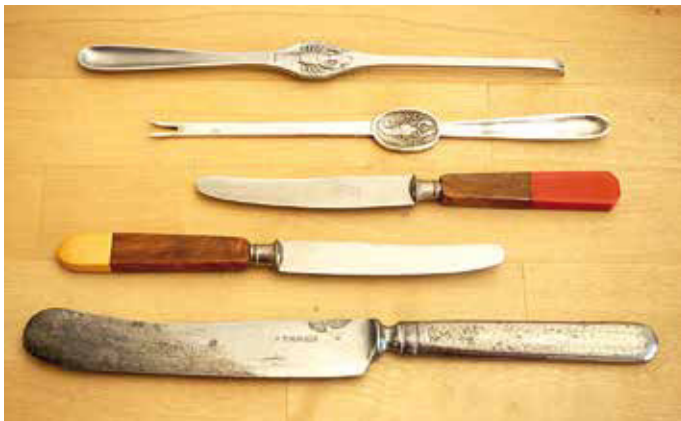
Vor dem Vergessen bewahrt: Hummergabeln, Obstmesser und die Buckelsklinge, die Vorlage für eine Neuanfertigung sein wird.

www.viennablade.com + www.deutsche-messermacher-gilde.de